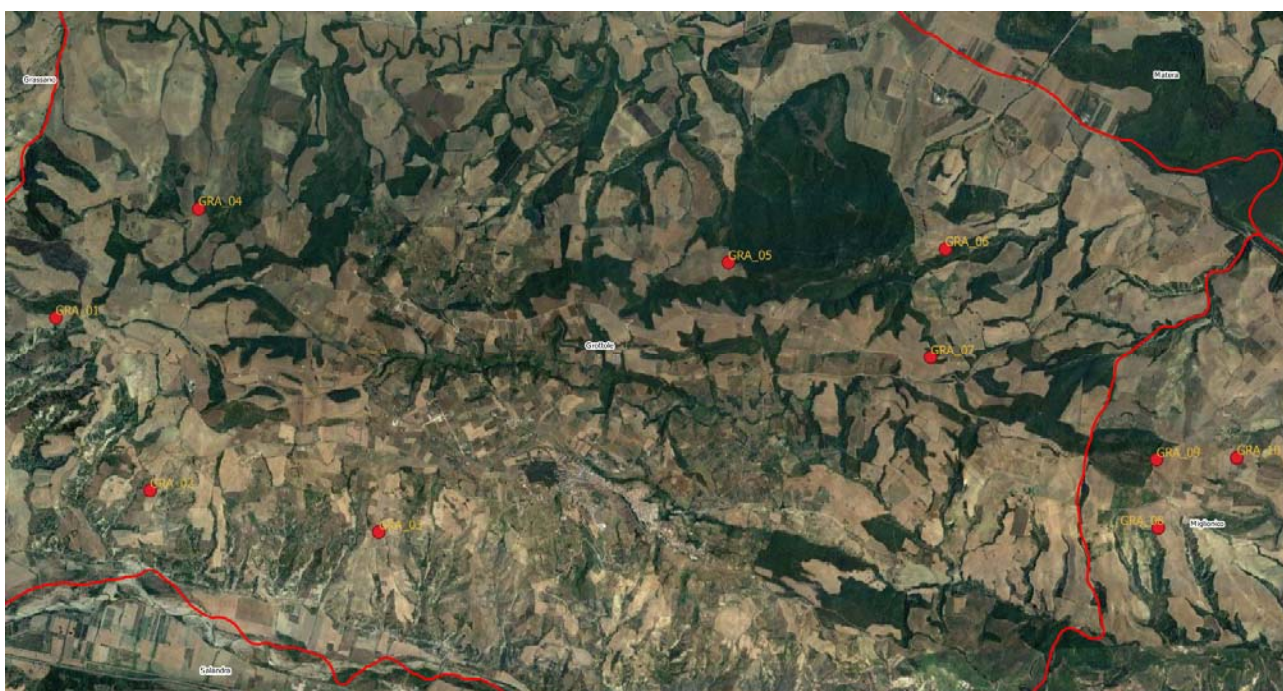
Figura 2: layout di impianto su base ortofoto

La disposizione degli aerogeneratori è stata scelta in modo da evitare il cosiddetto “effetto selva” dai punti di osservazione principali. Nella figura di seguito riportata è possibile visualizzare il lay-out del parco in oggetto su base ortofoto.