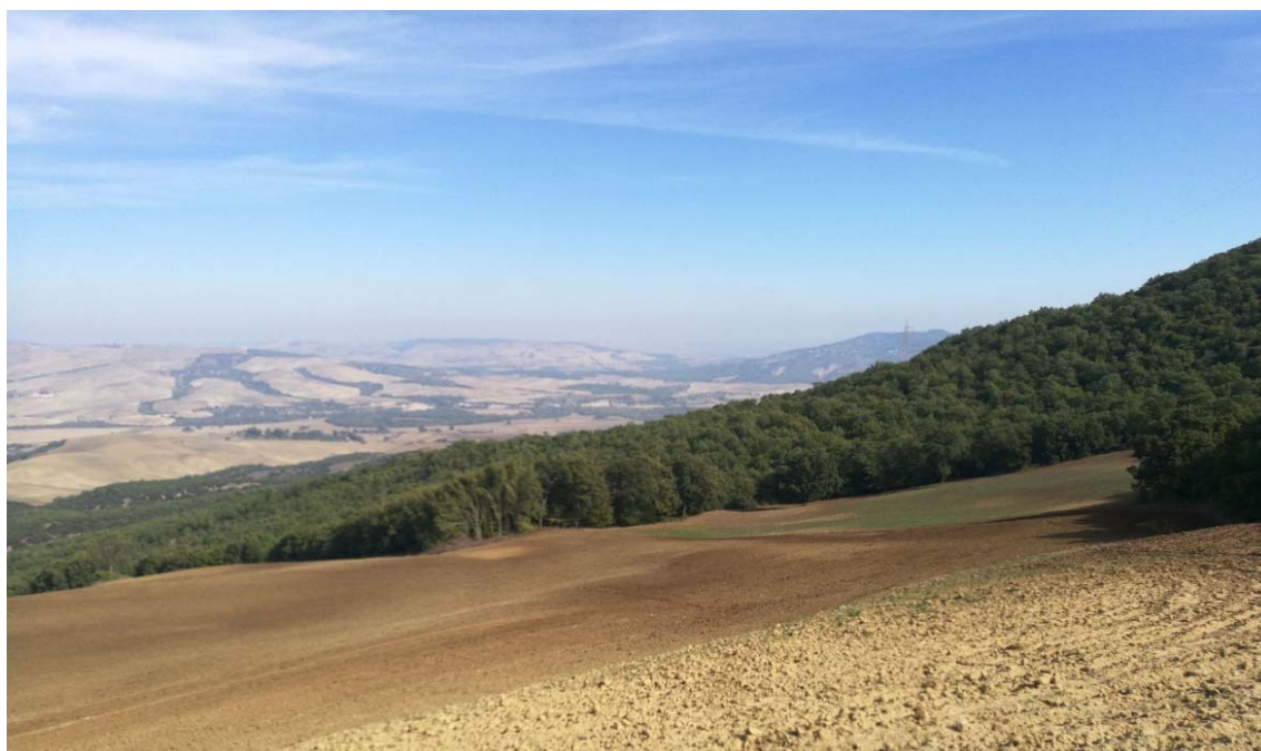
Figura 4: panoramica dell'area di intervento prossima all'installazione della WTG GRA_05