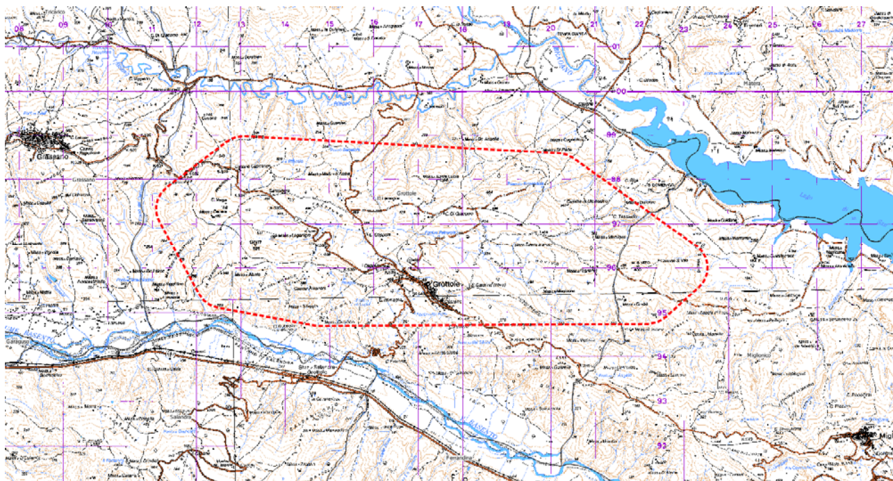
Figura 1: inquadramento territoriale su base IGM 1:50000 con indicazione dell'area di intervento

La disposizione degli aerogeneratori è stata scelta in modo da evitare il cosiddetto "effetto selva" dai punti di osservazione principali. Nella figura di seguito riportata è possibile visualizzare il lay-out del parco in oggetto su base ortofoto.