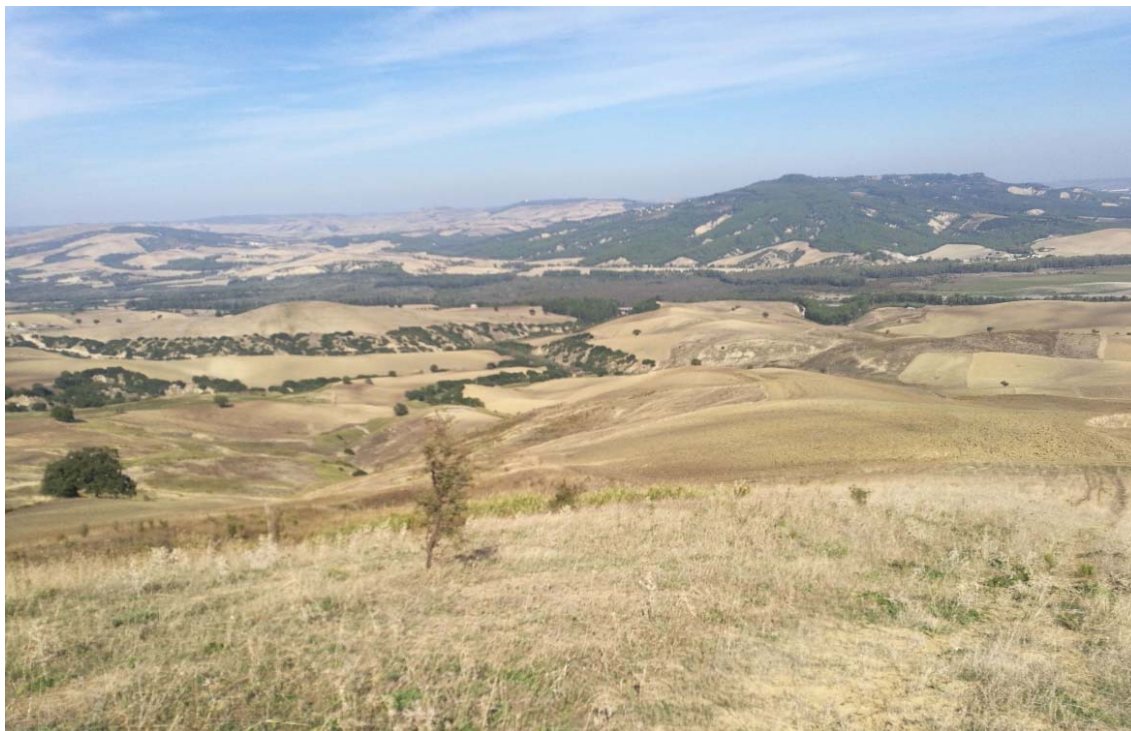
Figura 5: panoramica dell'area di intervento prossima all'installazione della WTG GRA_10