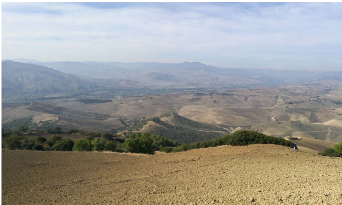
Figura 3: panoramica dell'area di intervento prossima all'installazione della WTG GRA_01