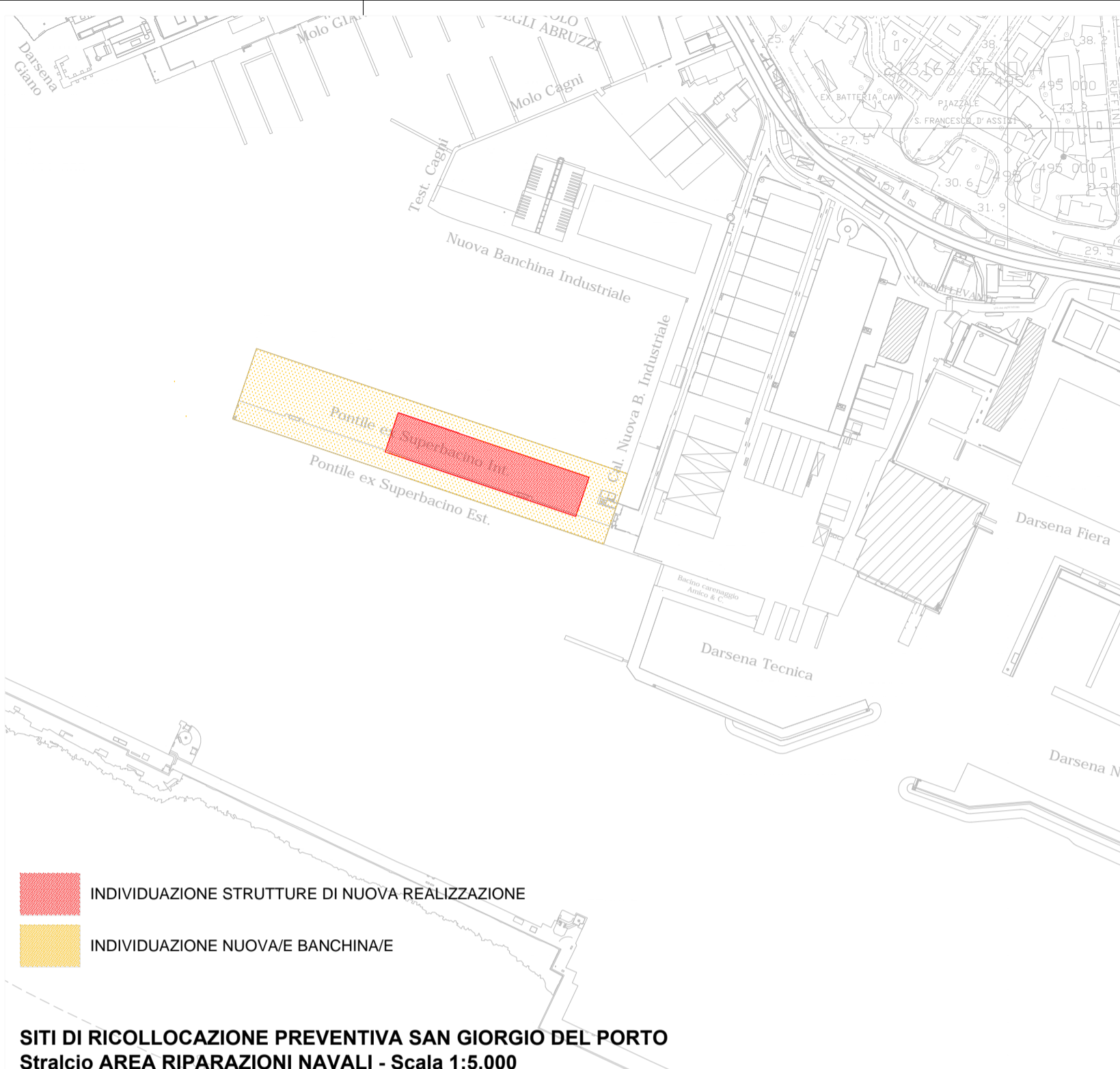
SITI DI RICOLLOCAZIONE PREVENTIVA SAN GIORGIO DEL PORTO Stralcio AREA RIPARAZIONI NAVALI - Scala 1:5.000