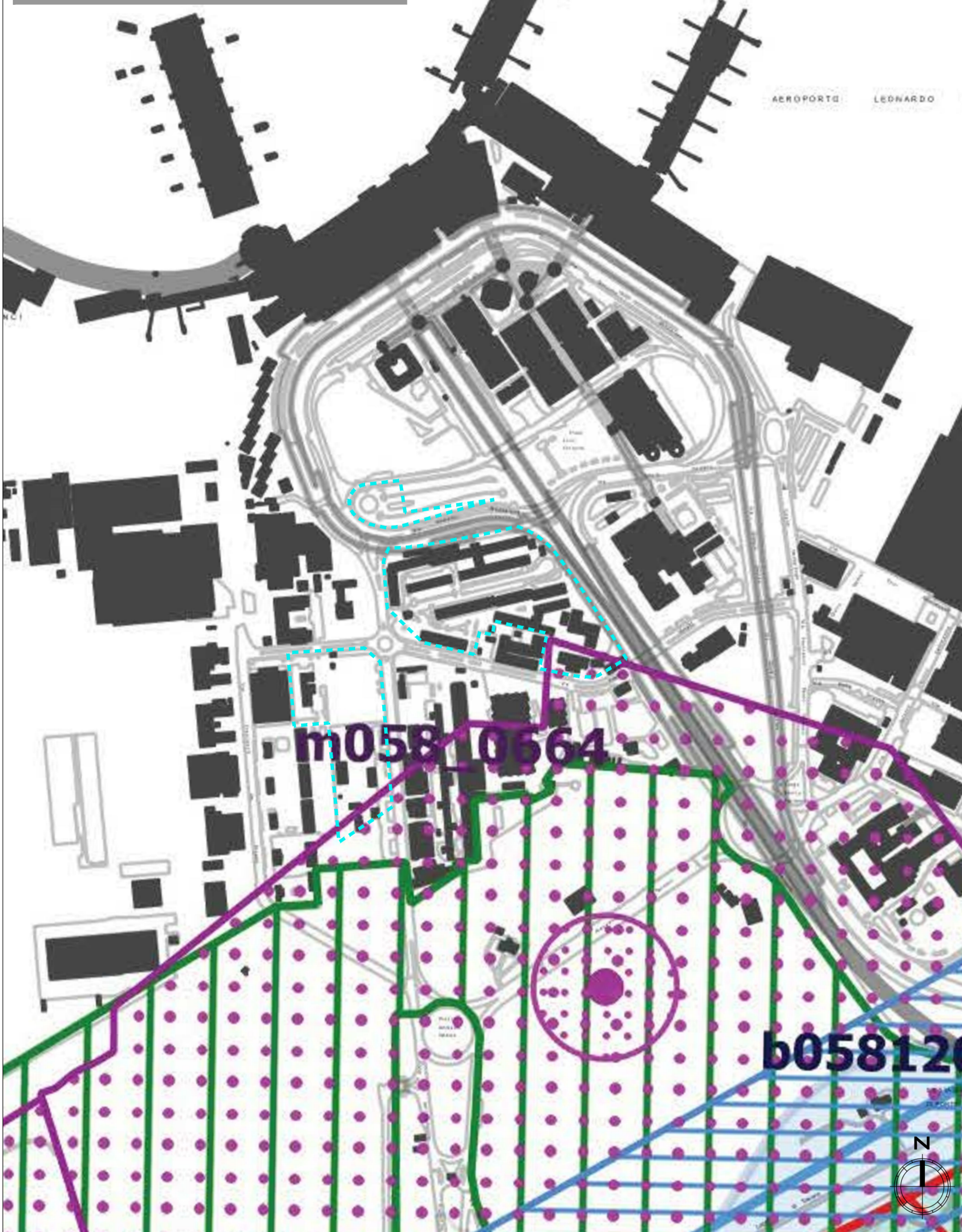
PTPR Tavola B- Scala 1: 5.000