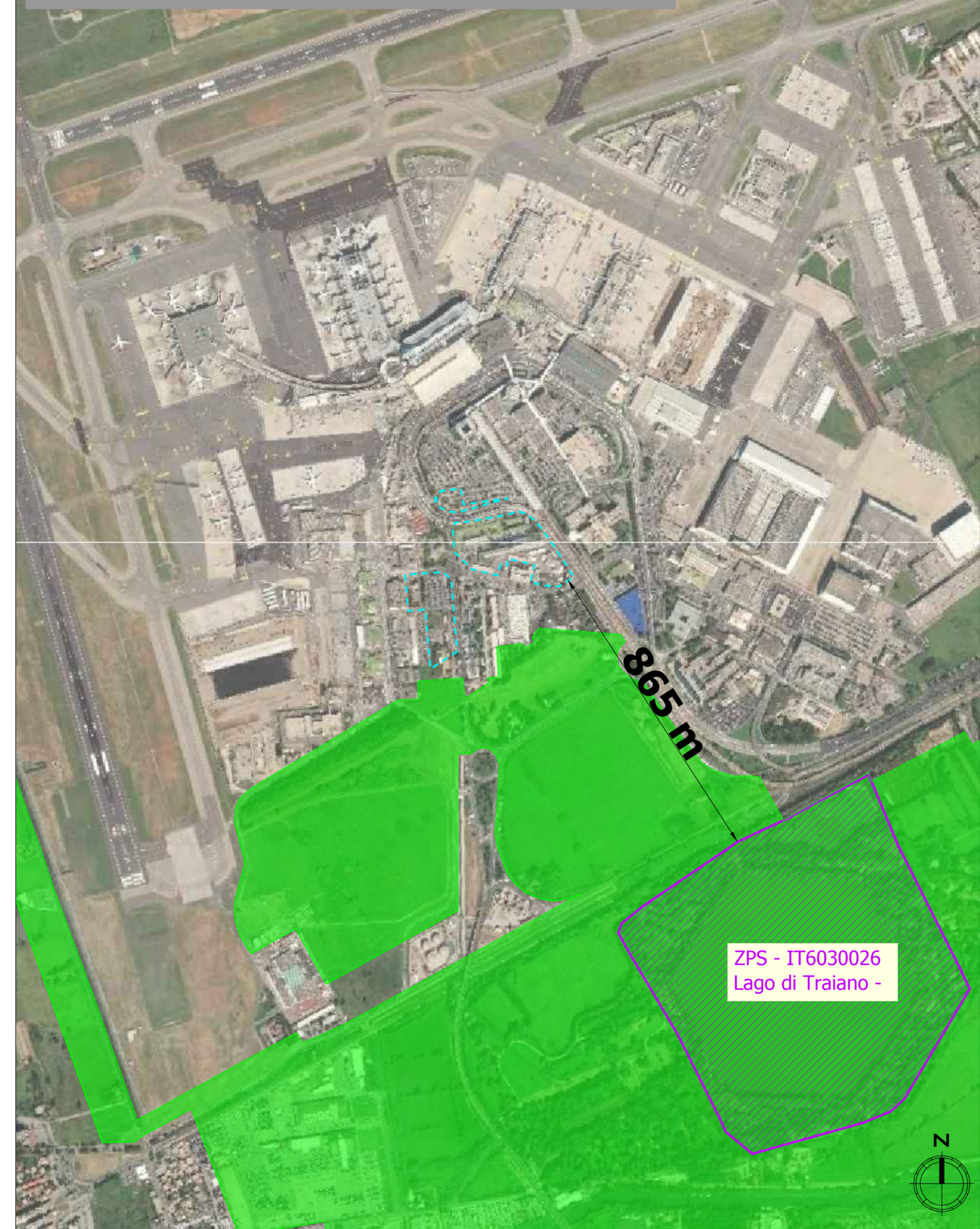
Aree protette e Rete Natura 2000 - Scala 1: 10.000