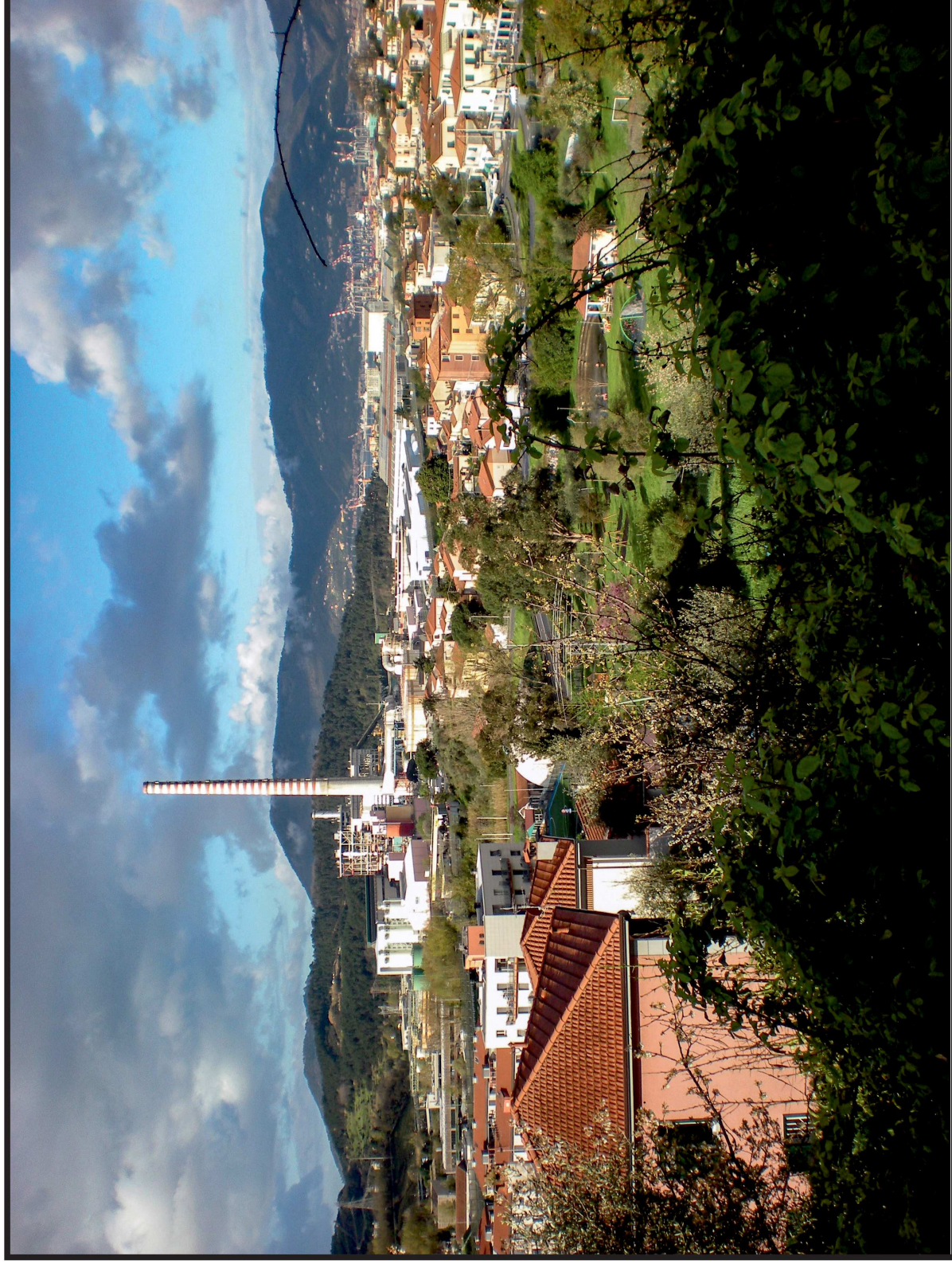
LA SPEZIA - CENTRALE ENEL - EUGENIO MONTALE - - VISTA I - STATO ATTUALE