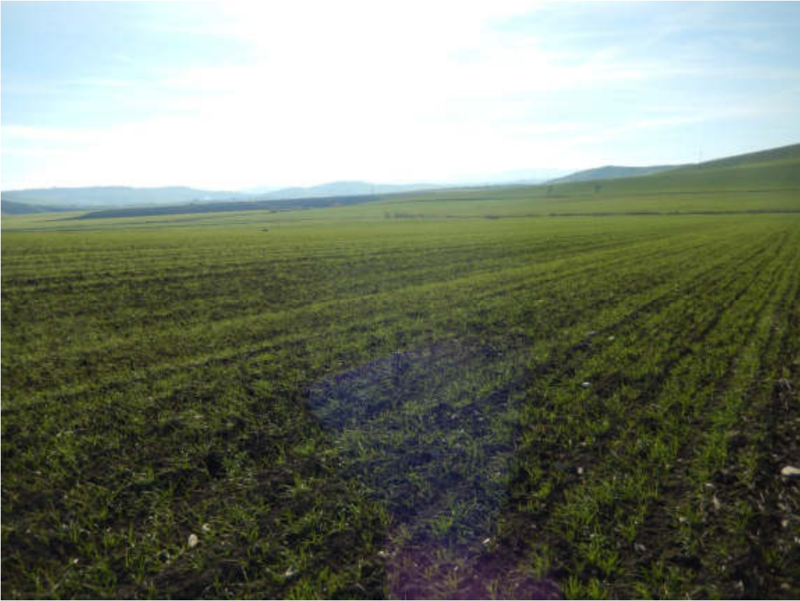
Figura 7 Scatto n. 53