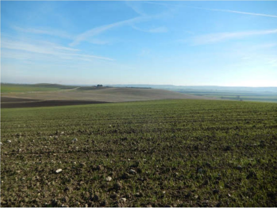
Figura 4 Scatto n. 50