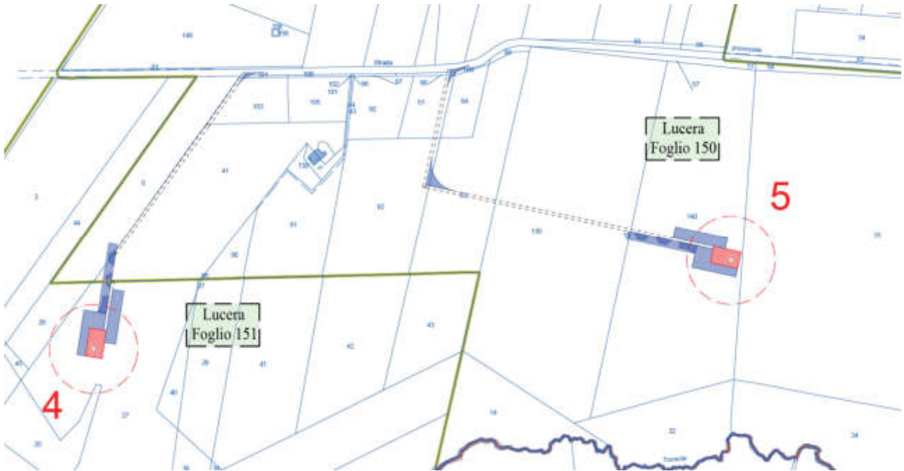
Figura 1 Stralcio planimetria catastale

La scelta del tracciato della viabilità che conduce alla WTG n. 5, invece, è stata obbligata al fine di non interferire con i reticoli secondari di cui alla carta Idrogeomorfologica, così come riportato nell'elaborato GEO-07 STRALCIO CARTA IDROGEOMORFOLOGICA di cui se ne rappresenta in Figura 2 la parte interessata.