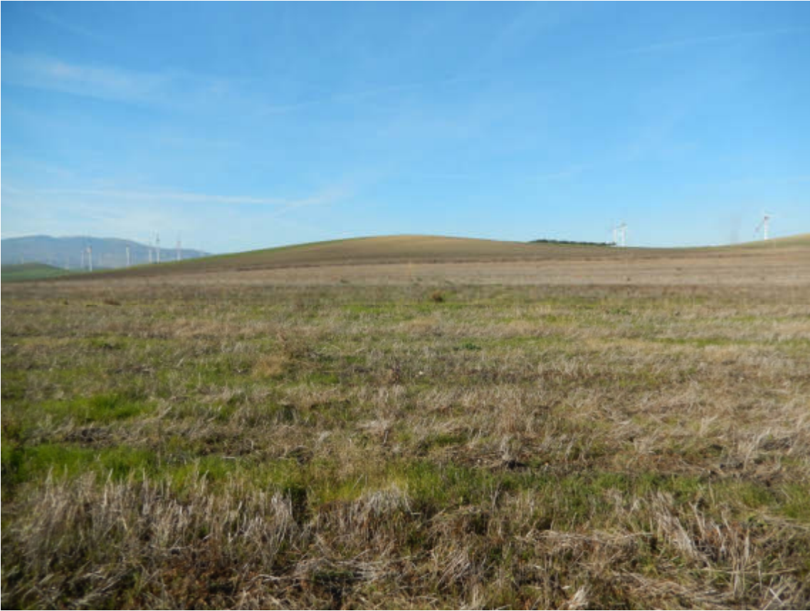
Figura 5 Scatto n. 51