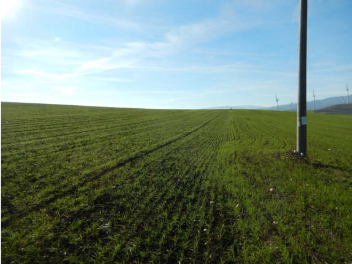
Figura 6 Scatto n. 52