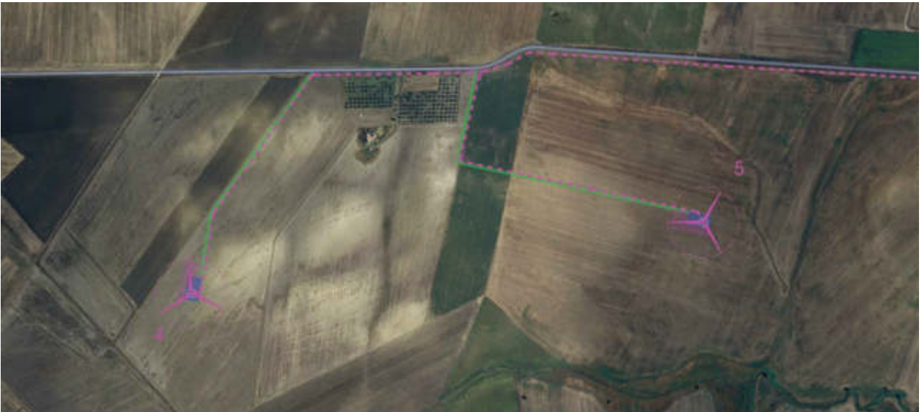
Figura 8 Stralcio Ortofoto