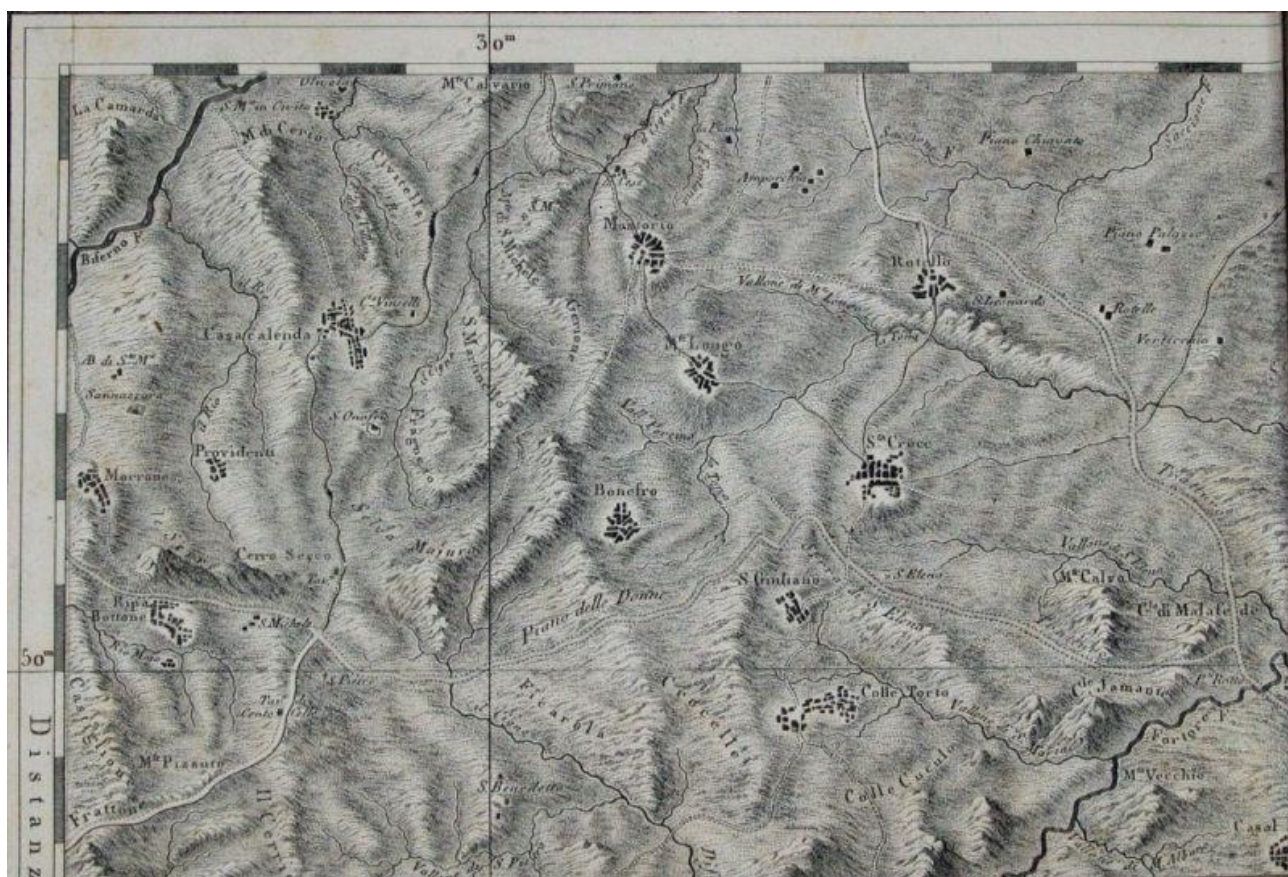
Giovanni Antonio Rizzi Zannoni. Atlante geografico del Regno di Napoli (1808).