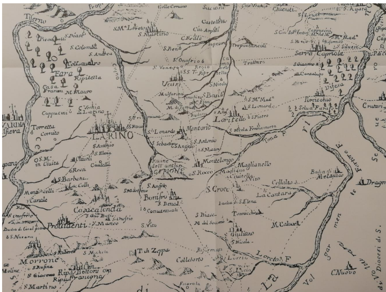
Diocesi di Larino (TRIA 1744).