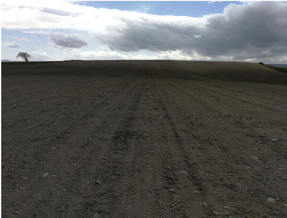
S. Croce di Magliano (CB), località Melanico. Area della T. 6