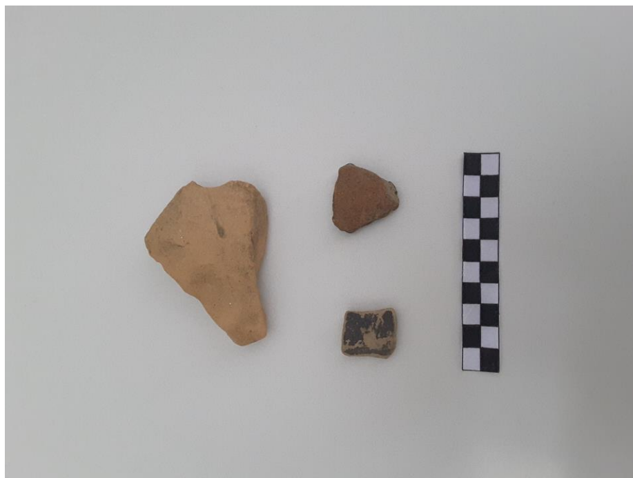
Materiali dalla part. catastale n. 10 (T. 6)