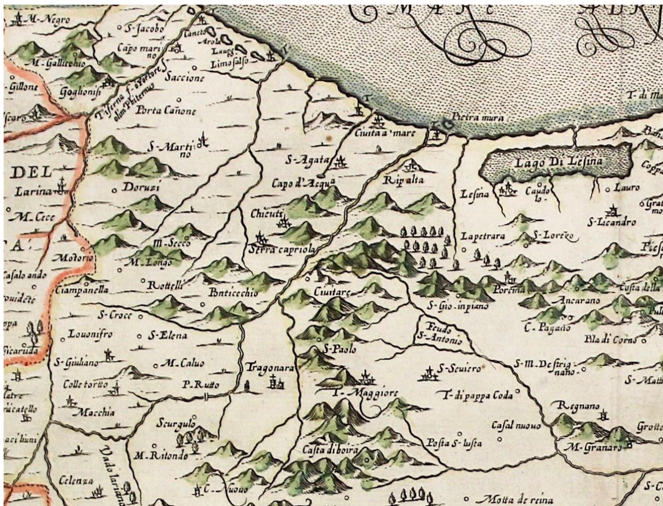
Giovanni Antonio Magini, Atlante geografico d'Italia (1620).