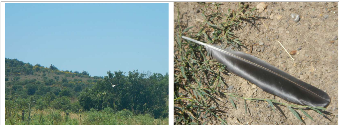
Sito FAU/10 - Airone guardia buoi (sinistra) e piuma di cornacchia grigia (destra)