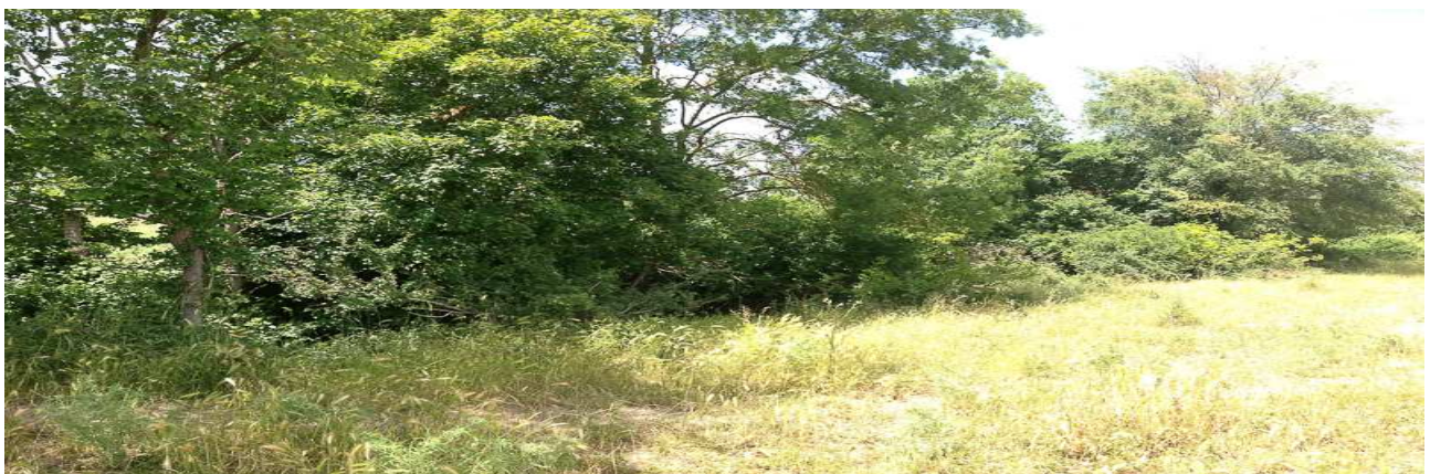
Sito FAU/10 - Panoramica

Il sito FAU/10 si colloca all'interno della Tenuta Comunale di Monte Calvo, Azienda zootecnica pubblica per l'allevamento biologico della vacca di razza "maremmana". Esso è posto in un impluvio piuttosto profondo di probabile presenza di acque piovane nelle stagioni primaverile e autunnale, delimitato nella parte superiore da affioramenti di tufo, ed è caratterizzato da vegetazione boschiva in prevalenza arborea e arbustiva. L'impluvio in questione va a confluire verso NW nel tracciato della SS1bis ed è interno ai recinti di allevamento e movimentazione del bestiame. Pertanto la sua raggiungibilità, altrimenti agevole, dipende dall'utilizzo che gli allevatori fanno dei pascoli circostanti, tutti delimitati da recinzioni.