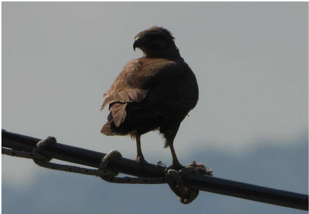
Poiana ( Buteo buteo ) fotografata il 19/02/2019