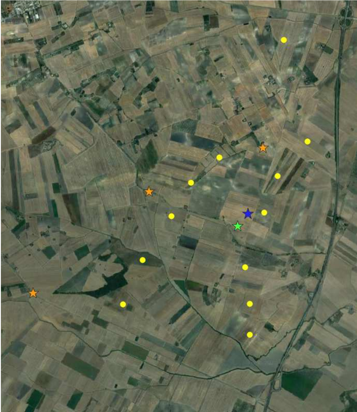
Localizzazioni delle osservazioni dei rapaci effettuate il 19/02/2020

★ poiana ★ gheppio ★ albanella reale ● wtg in progetto