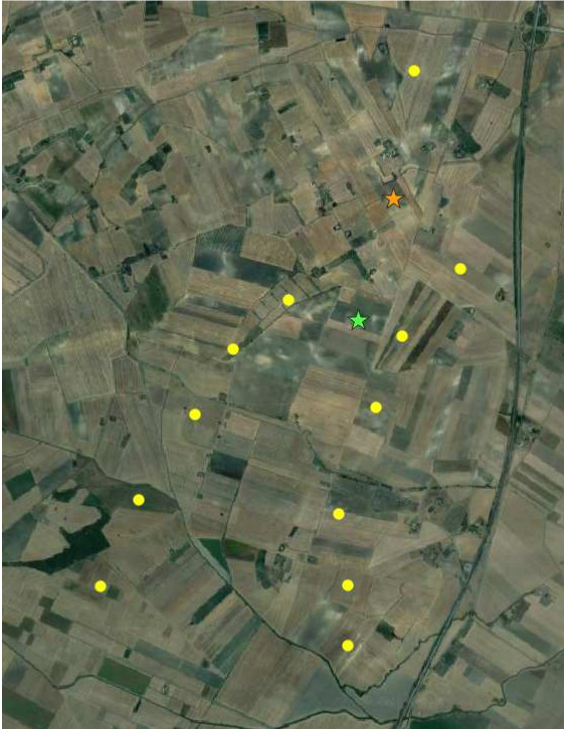
Localizzazioni delle osservazioni dei rapaci effettuate il 31/01/2020