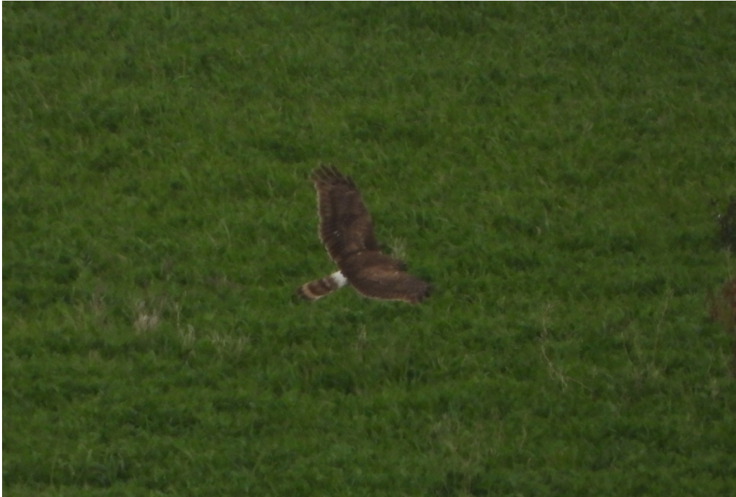
Albanella reale ( Circus cyaneus ) fotografata il 19/02/2019