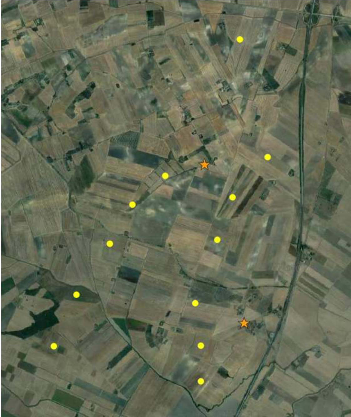
Localizzazioni delle osservazioni dei rapaci effettuate il 28/02/2020