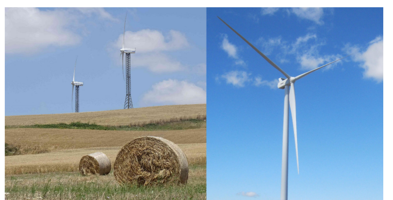
STUDIO DI IMPATTO AMBIENTALE

PROGETTO PARCO EOLICO FORENZA-MASCHITO POTENZIAMENTO IMPIANTO DI FORENZA