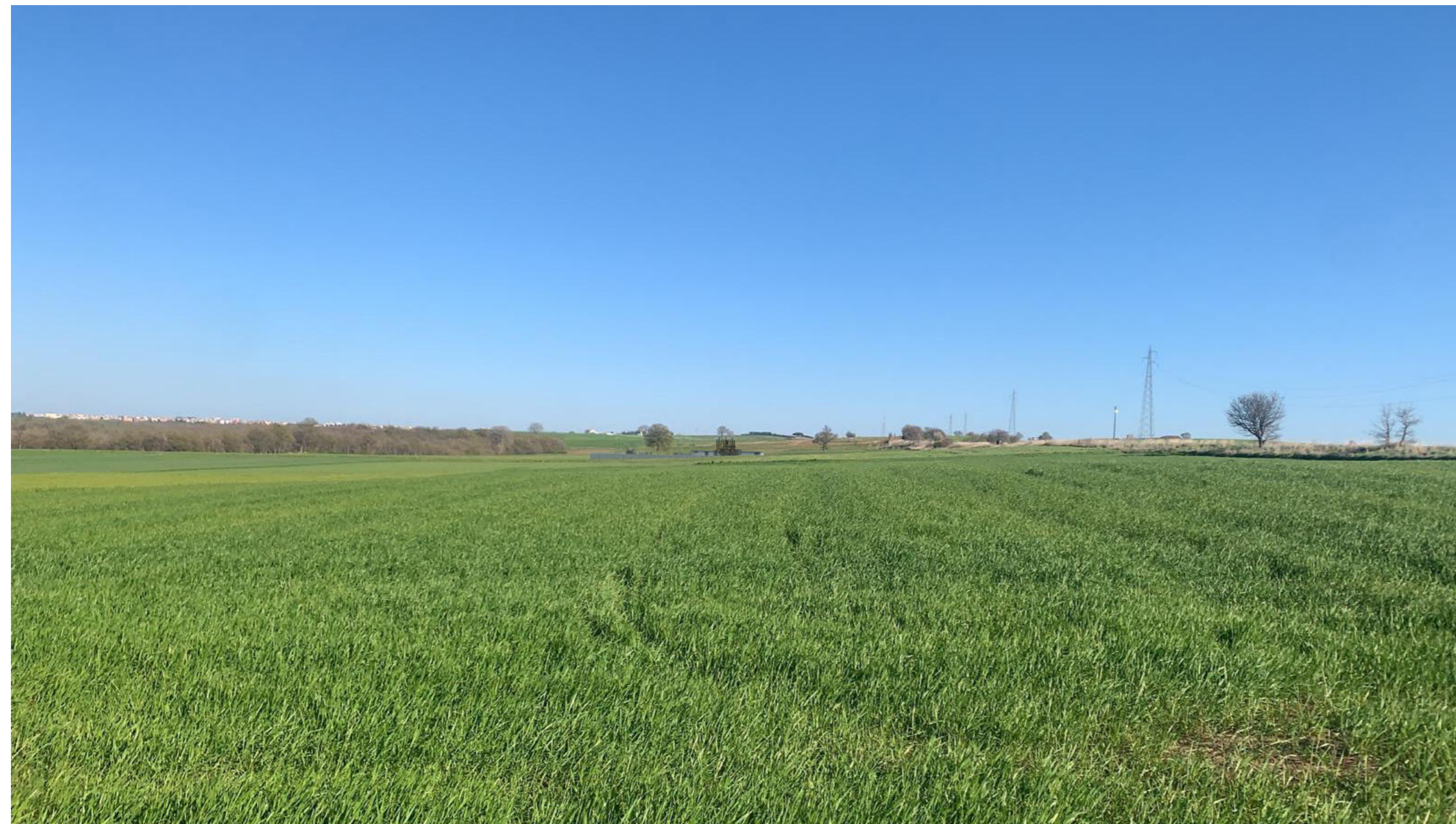
Stato di progetto