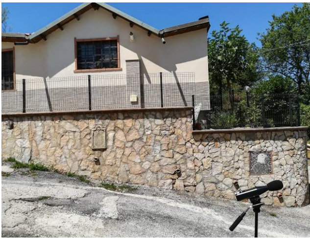
FOTO DEL RICETTORE