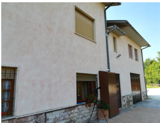
FOTO DEL RICETTORE