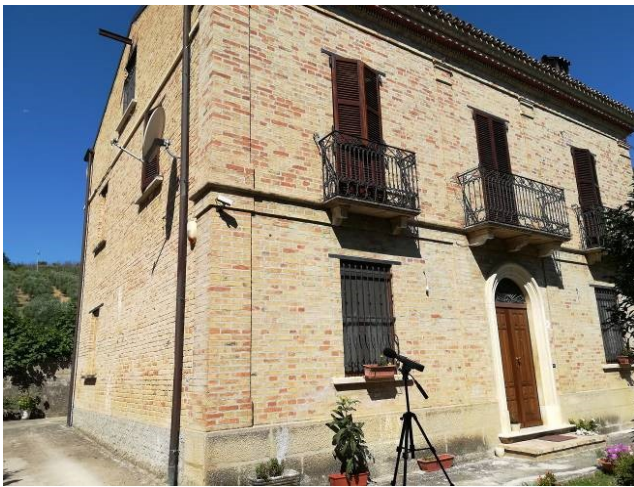
FOTO DEL RICETTORE