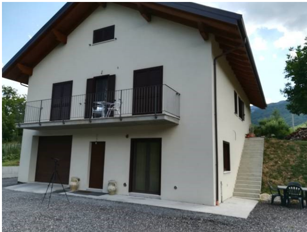
FOTO DEL RICETTORE