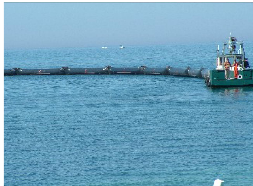
Schermo di protezione rappresentazione della fase di separazione e confinamento dell'area interessata dal dragaggio con panne, dotate di gonne.