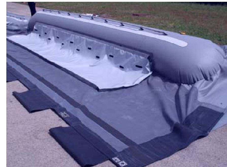
Rappresentazione delle panne galleggianti con gonne