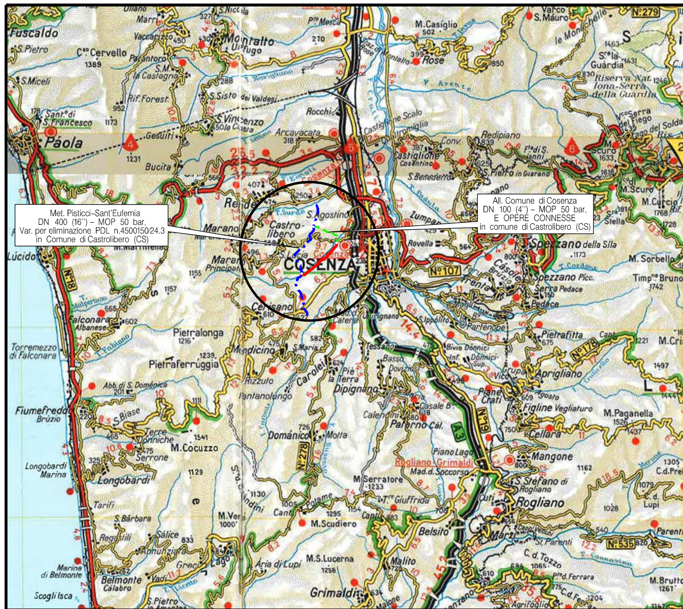
COROGRAFIA Scala 1:200.000