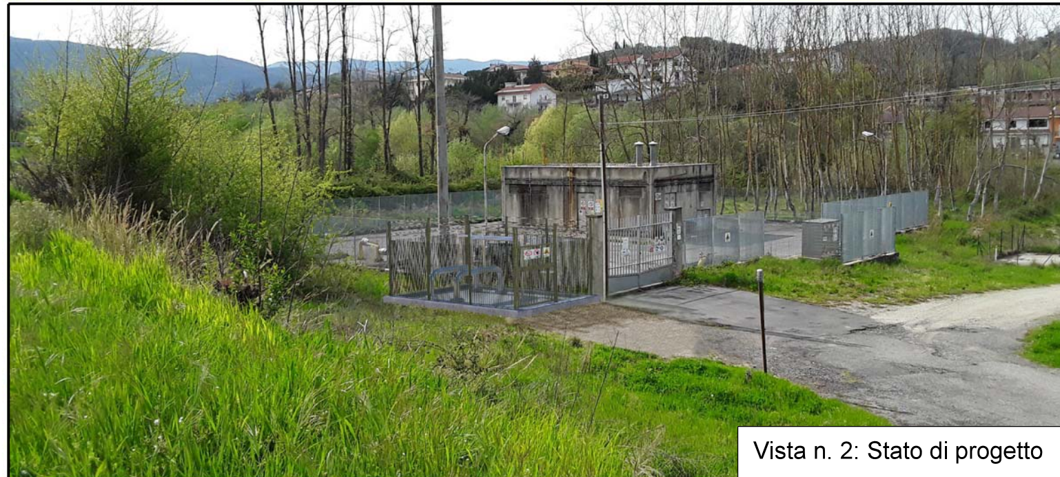
Vista n. 2: Stato di progetto