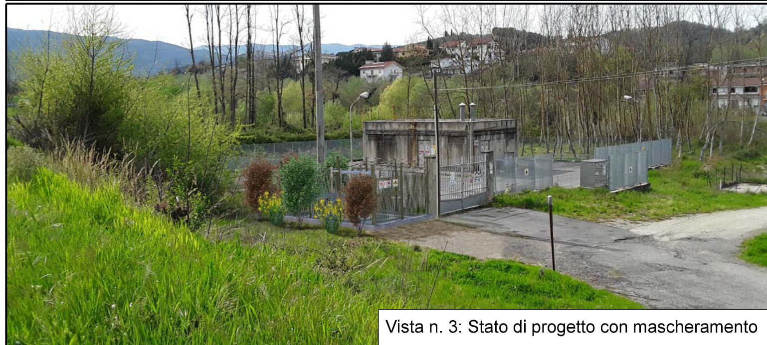
Vista n. 3: Stato di progetto con mascheramento