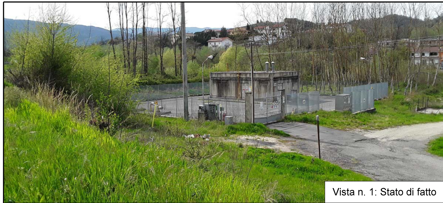
Vista n. 1: Stato di fatto