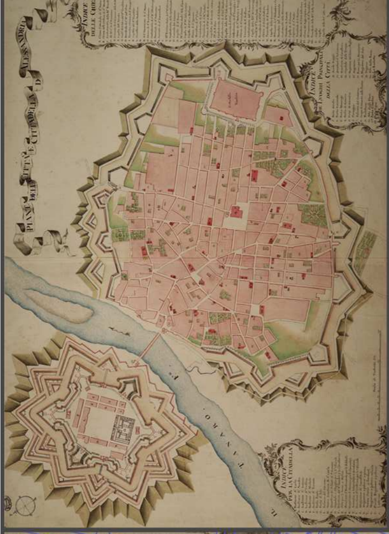
Pianta della città e cittadella d'Alessandria, XVIII sec.