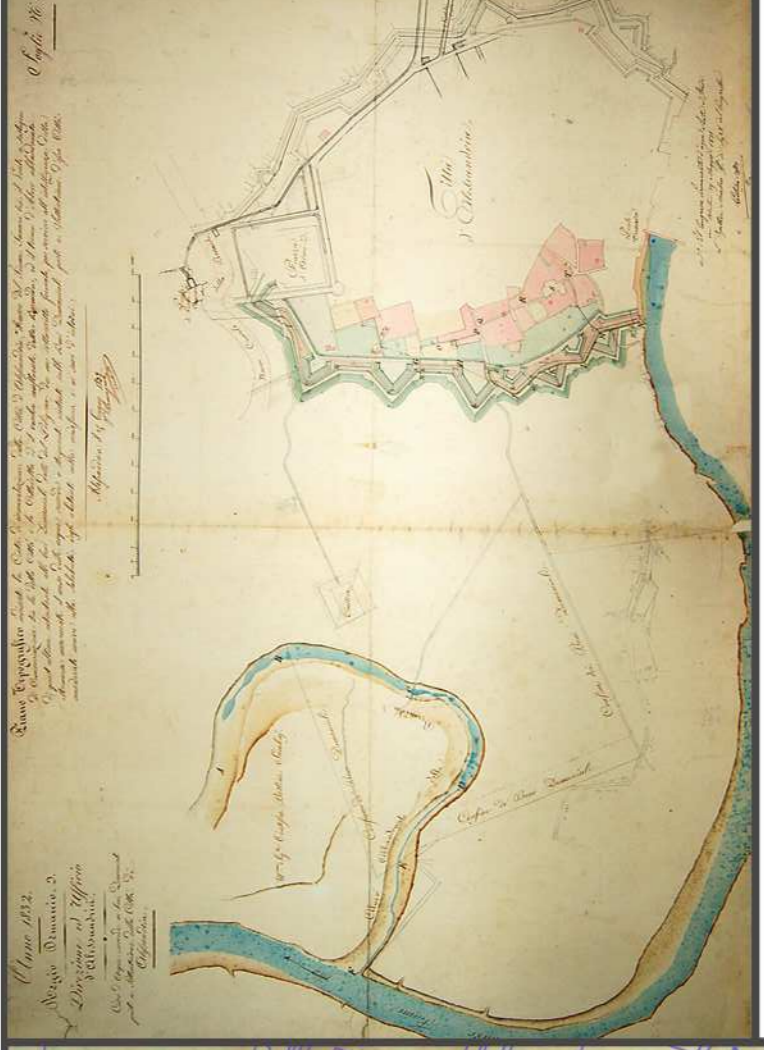
Pianta topografica indicante la cinta di circovallazione della città di Alessandria, 1832.

Archivio di Stato di Alessandria, Archivio Storico del Comune di Alessandria, serie III, 2261, 384.