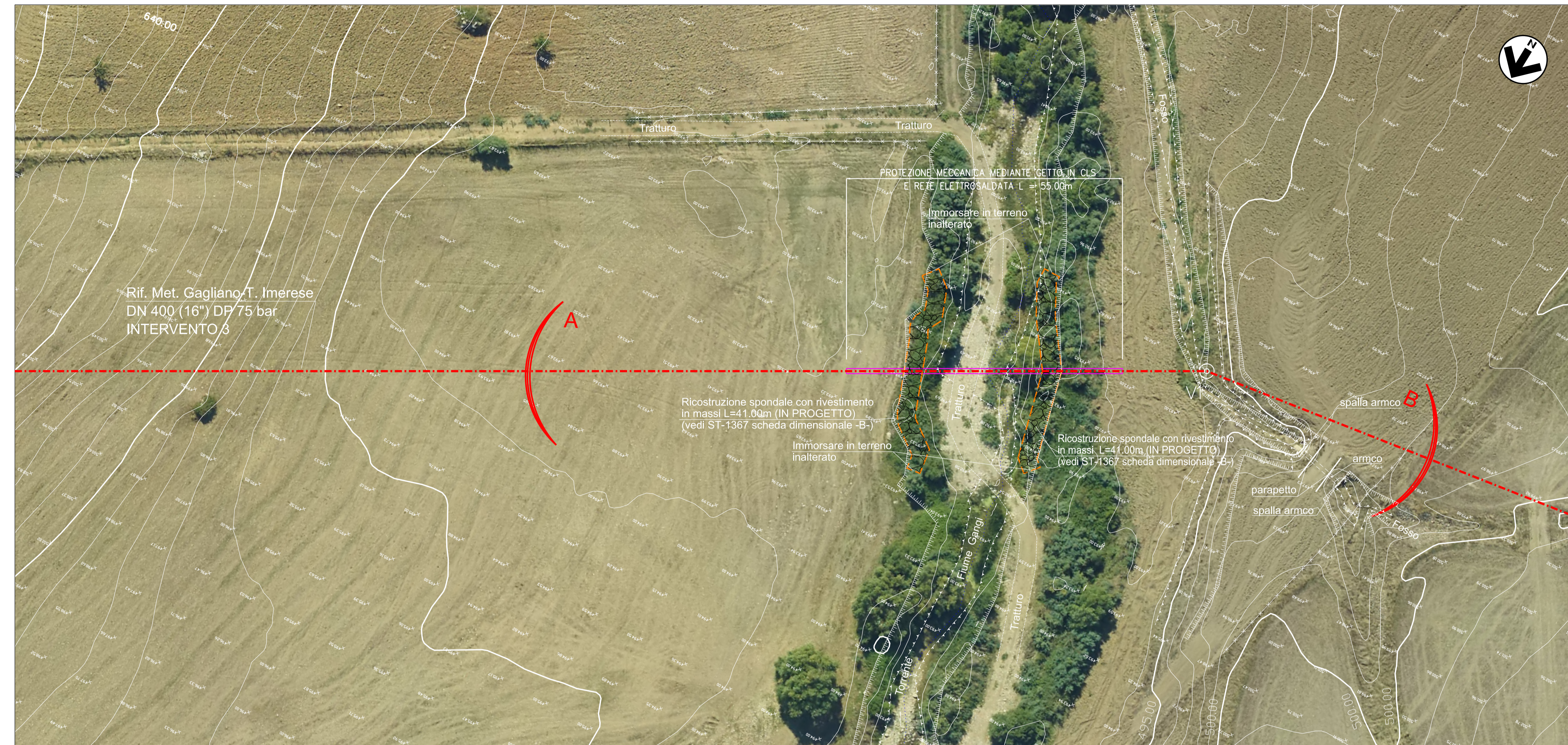
PIANO QUOTATO scala 1:500