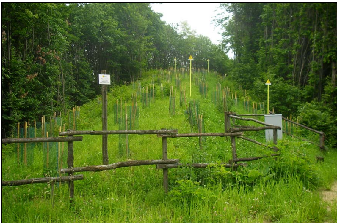
Foto 4.1/C: Ripristini vegetazionali e di staccionate preesistenti a bordo sentiero (Metanodotto Allacciamento di Vado Ligure)