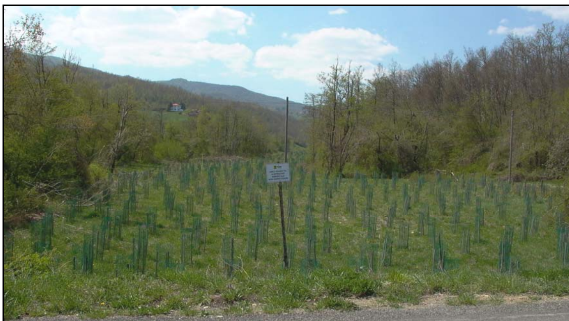
Foto 4.1/B: tratto ripristinato con piantagione diffusa (Metanodotto Borgotaro – Sestri Levante)