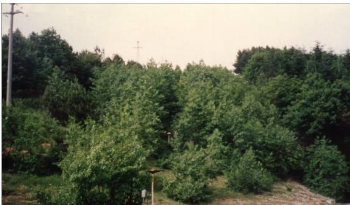
Foto 4.1/A: Metanodotto realizzato nel 1985 - la vegetazione naturale (non sono stati eseguiti ripristini) sta ricoprendo la pista di lavoro del metanodotto

A titolo esemplificativo, si allegano alcune immagini fotografiche che illustrano la realizzazione di ripristini in corrispondenza di tratti boscati lungo il tracciato di alcuni metanodotti realizzati negli anni '80 (con ripristini affrancati) ed altri più recenti (vedi Foto 4.1/A÷4.1/D).