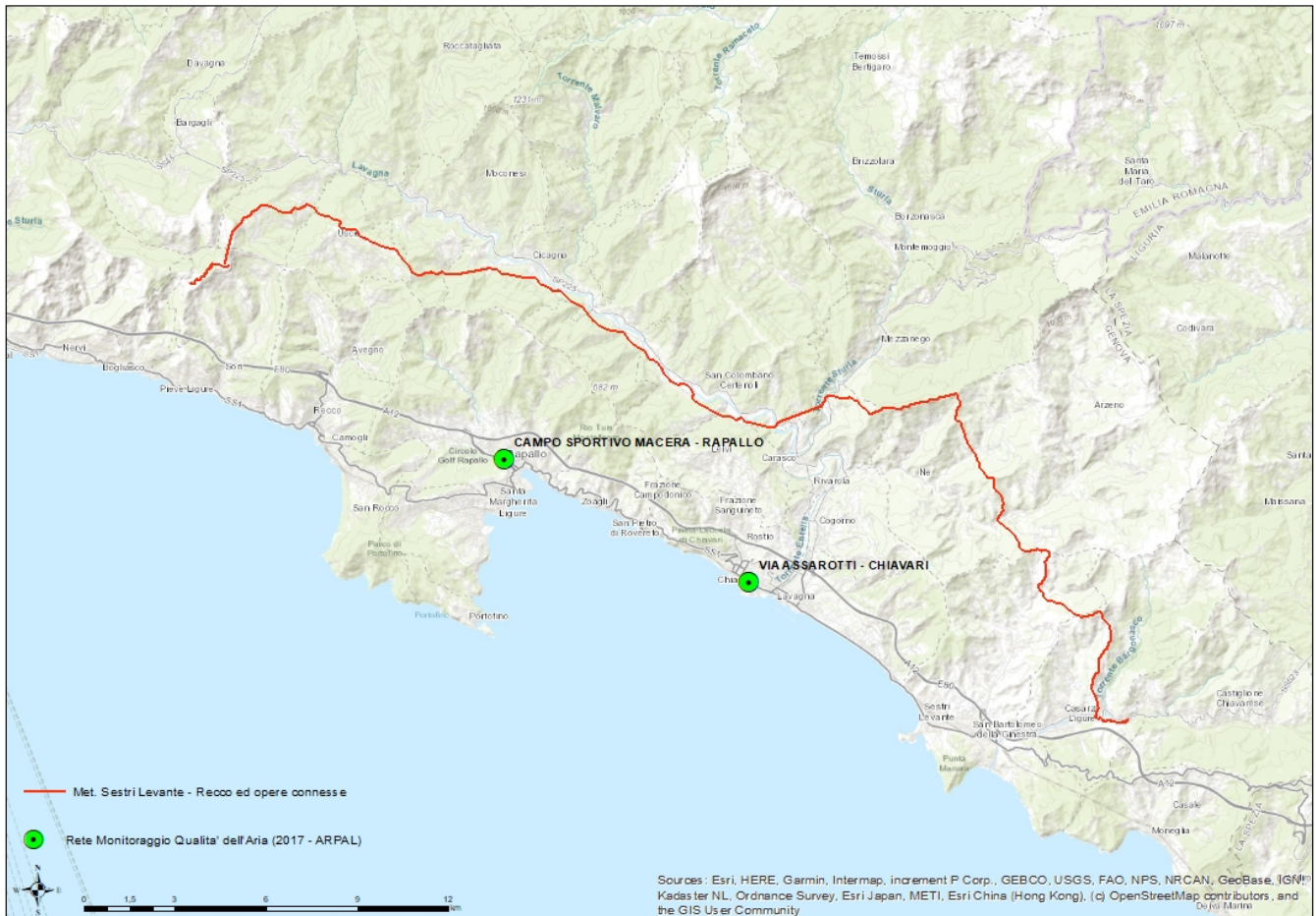
Fig. 6.1.A: Stazioni delle Rete di Monitoraggio Regionale di qualità dell'aria riferite all'anno 2017