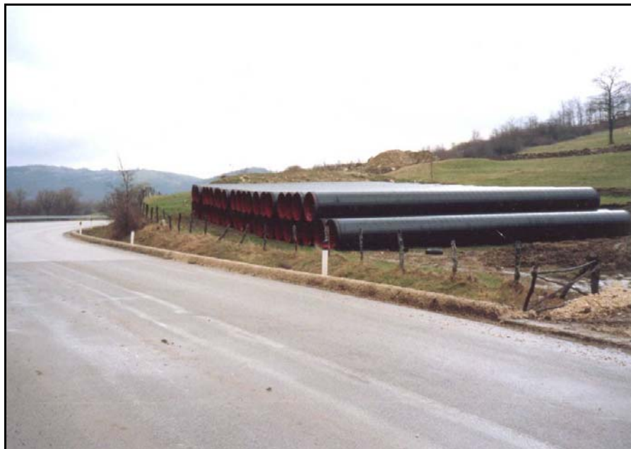
Foto 3.1.A: Piazzola di accatastamento tubazioni (esempio relativo ad altro metanodotto con tubi di diametro maggiore rispetto alla linea in progetto)