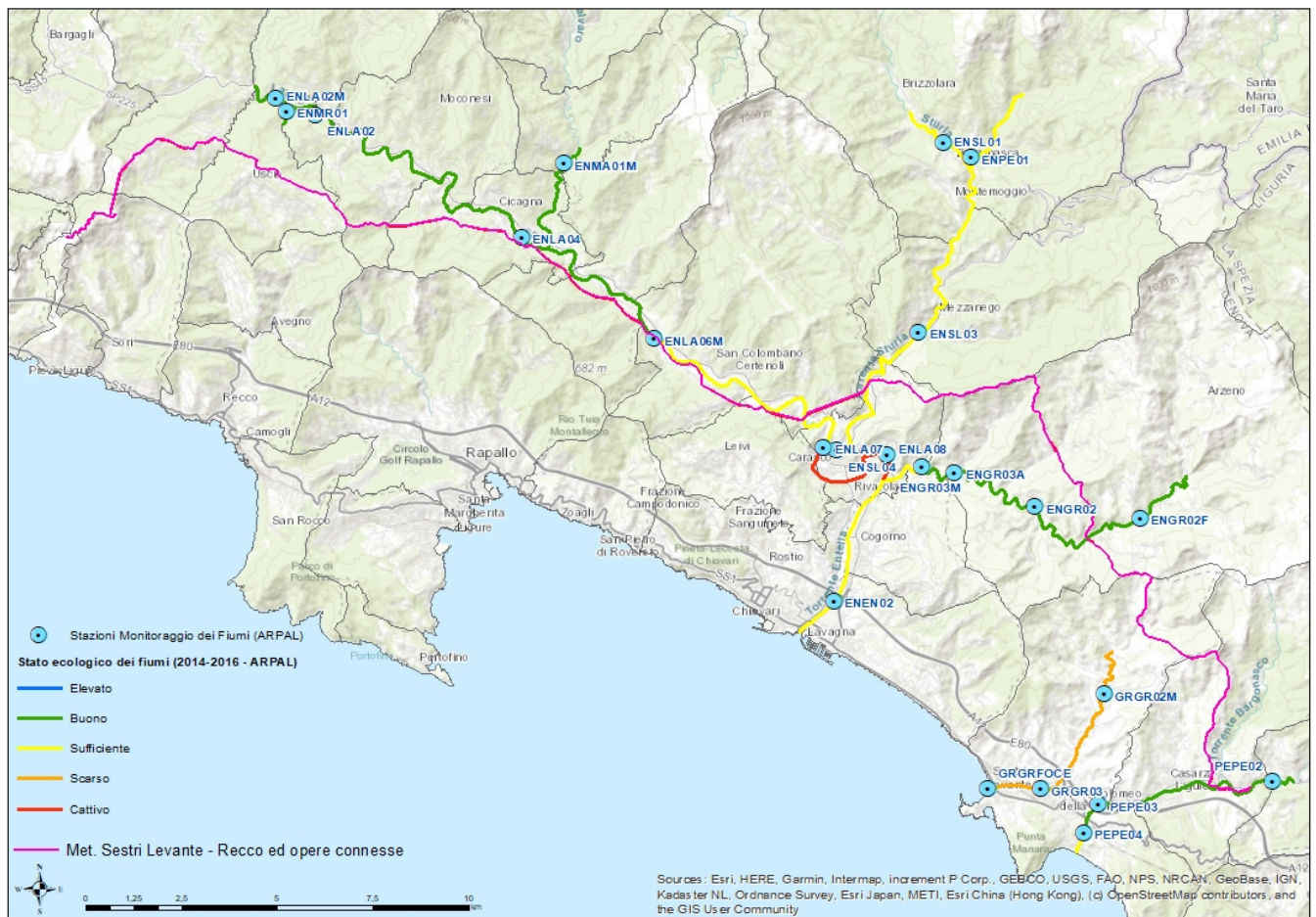
Fig. 6.2.A: Stazioni delle Rete di Monitoraggio Regionale dei corsi d'acqua superficiali e stato ecologico registrato negli anni (2014-2016)

Nella Fig. 6.2.A è riportata la rete di monitoraggio regionale dei fiumi e l'attribuzione dello stato ecologico rilevato dai campionamenti effettuati nel periodo 2014-2016.