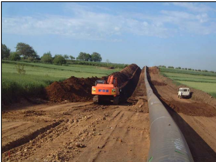
Foto 3.1.C: Scavo della trincea (esempio di condotta con diametro superiore alla linea in progetto)