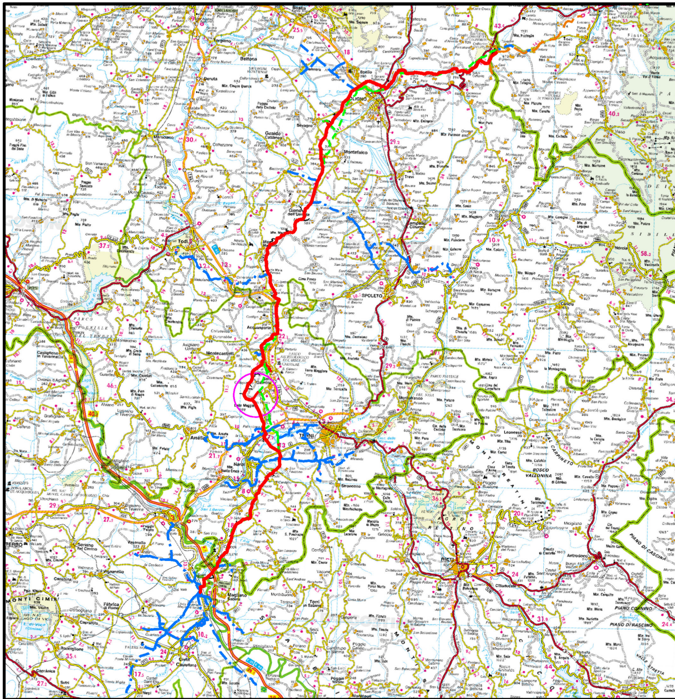
COROGRAFIA Scala 1:500.000

Il presente disegno è di proprietà aziendale - La Società tutelerà i propri diritti a termine di legge.