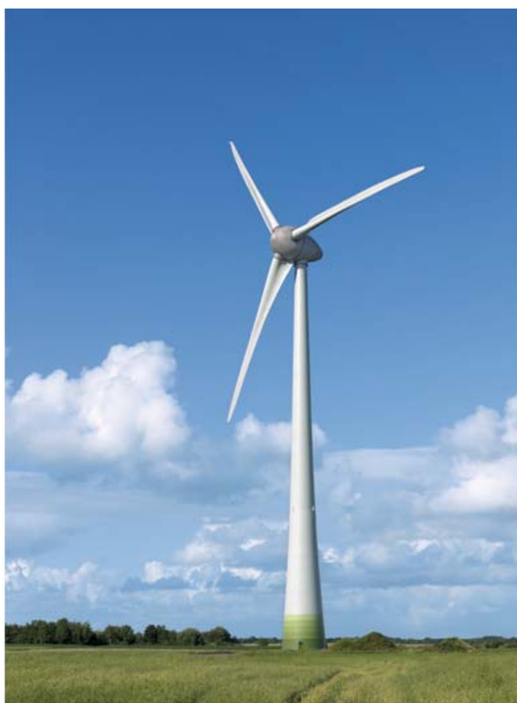
Figura 4 - aerogeneratore tipo da 6 MW.

In relazione alle caratteristiche del terreno le fondazioni saranno di due tipi: o di tipo profondo su pali (indirette) o dirette. Le verifiche di stabilità del terreno e delle strutture di fondazione saranno eseguite con i metodi e i procedimenti della geotecnica, tenendo conto delle massime sollecitazioni sul terreno che la struttura trasmette. Il piano di posa delle fondazioni sarà ad una profondità tale da consentire un agevole ripristino geomorfologico e vegetazionale dei luoghi al termine dei lavori di realizzazione e di dismissione del parco. Le fondazioni saranno completamente interrato e ricoperte dalla sovrastruttura di materiale arido della piazzola di servizio.