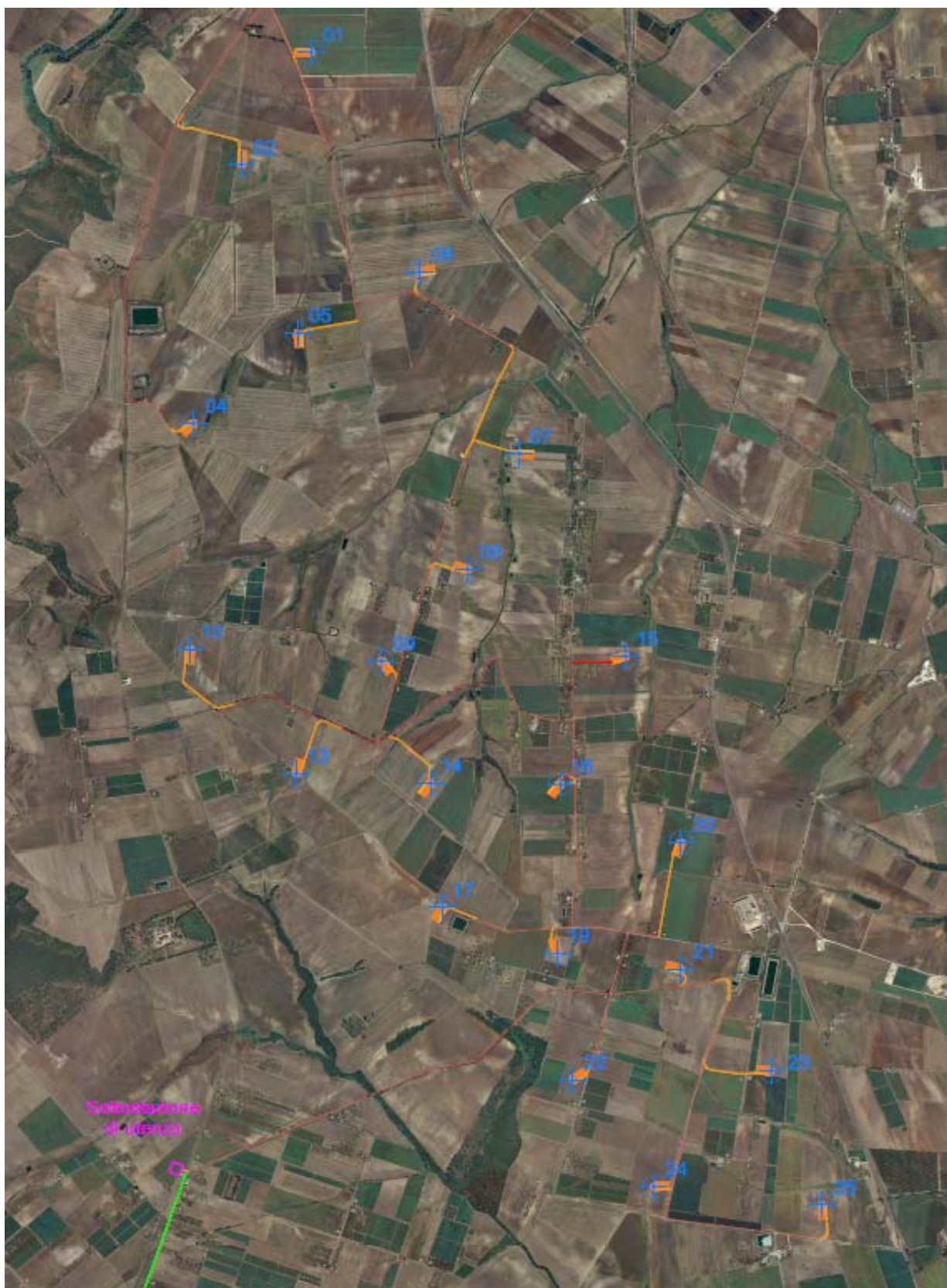
Fig. 3: aerogeneratori e cavidotti su ortofoto.