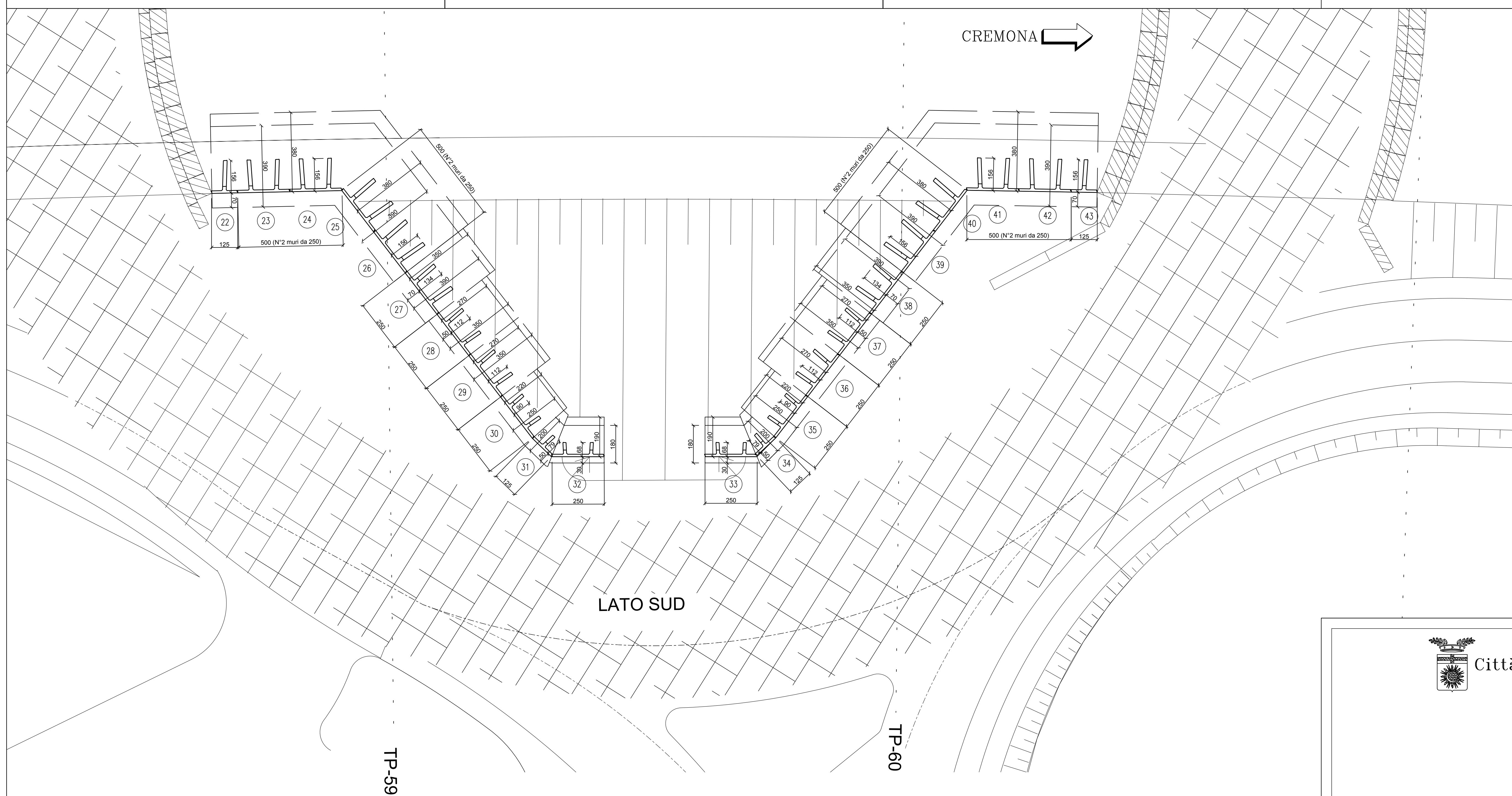
PROSPETTO MURI LATO SUD (LATO FACCIAVISTA) Scala 1:100