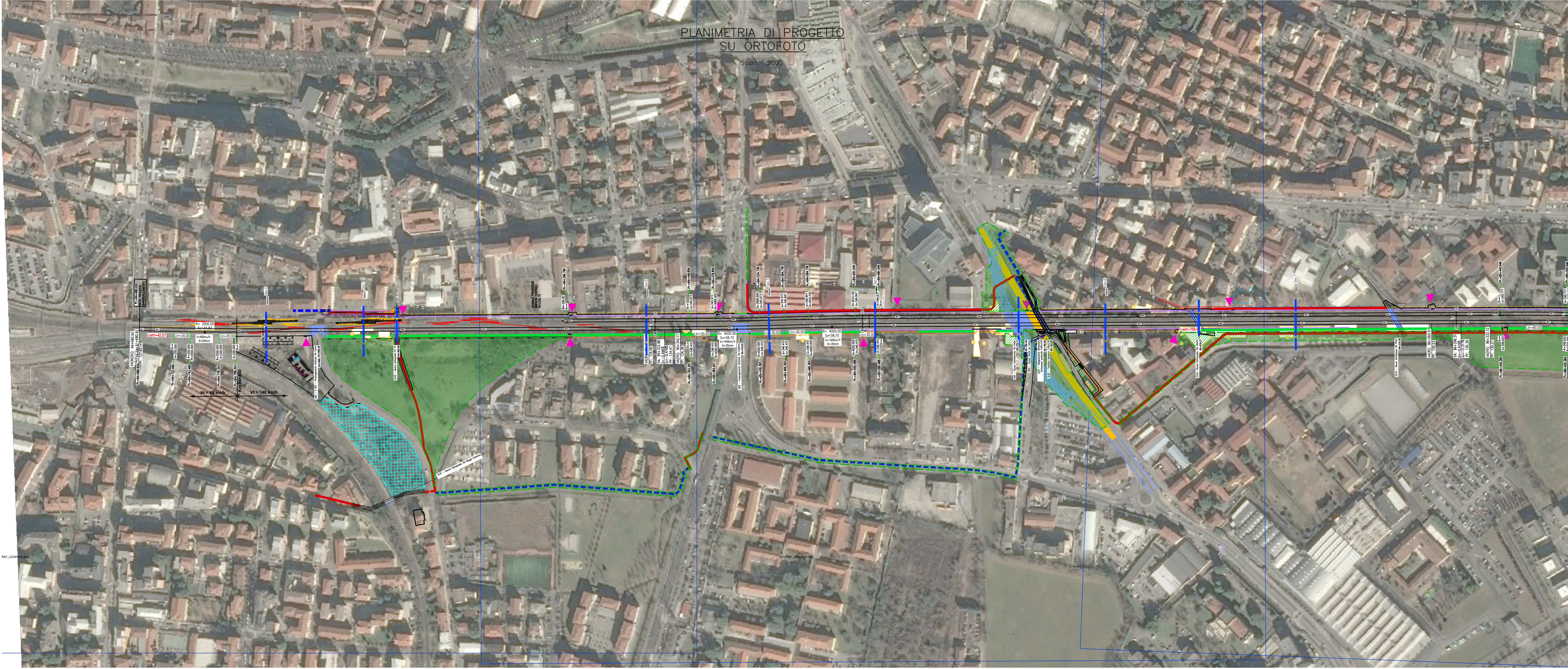
PLANIMETRIA DI PROGETTO SU ORTOFOTO Scala 1:2000