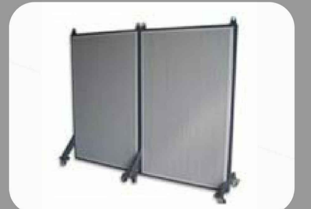
pannellature con funzione fonoassorbente