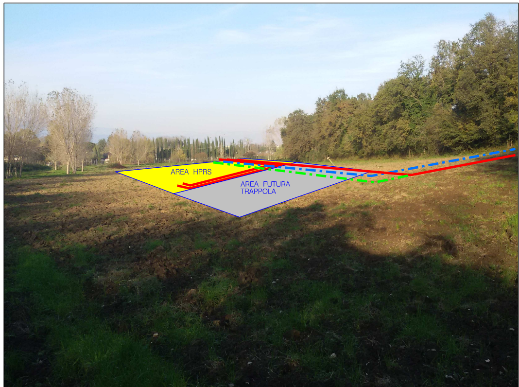
IMPIANTO HPRS 10 E VARIANTE

Il presente disegno e' di proprieta' aziendale - La Societa' tutelera' i propri diritti a termine di legge.