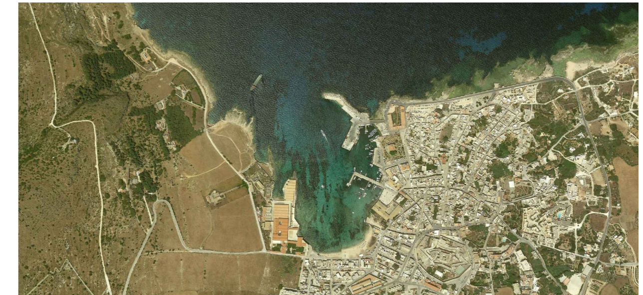
PROGETTO ESECUTIVO - 1° STRALCIO FUNZIONALE