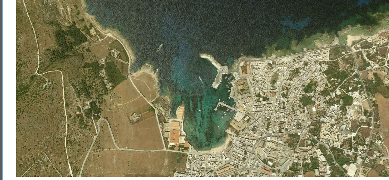
PROGETTO ESECUTIVO - 1° STRALCIO FUNZIONALE

Ufficio di progettazione: Ministero delle Infrastrutture e dei Trasporti Provveditorato Interregionale Opere Pubbliche Sicilia - Calabria Ufficio 3 Tecnico e Opere Marittime per la Sicilia