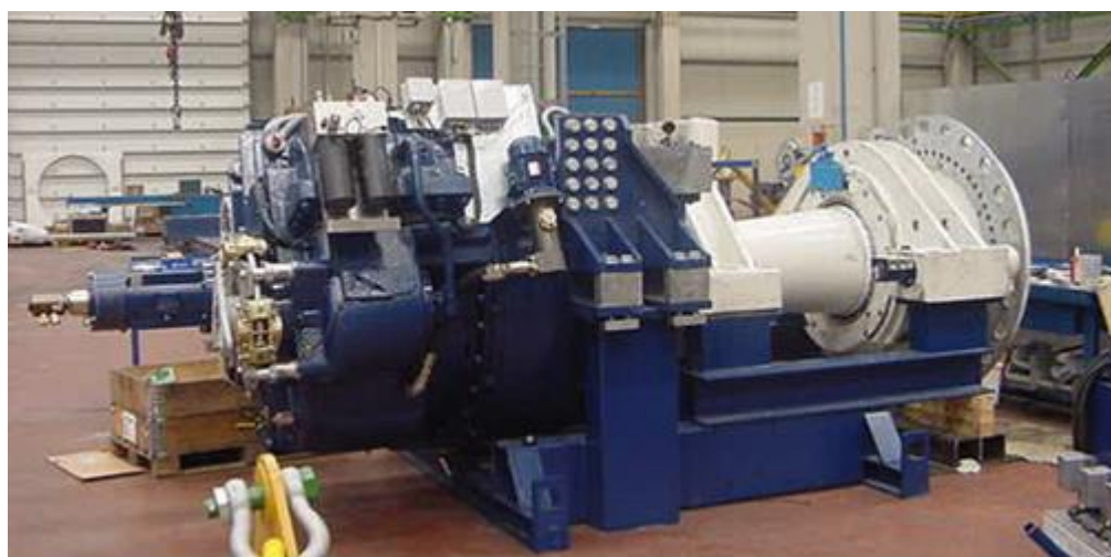
Figura 4: asse di alta velocità

Nel caso in cui qualche pezzo di questi componenti si trovi in buono stato si può pensare al loro riutilizzo in componenti simili.