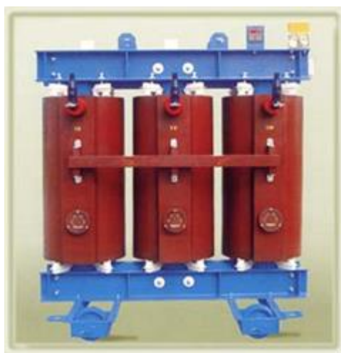
Figura 8: trasformatore

I materiali costituenti l'armatura e la carcassa esteriore verranno rottamati, così come il rame generato che si recupererà per la sua rifusione.