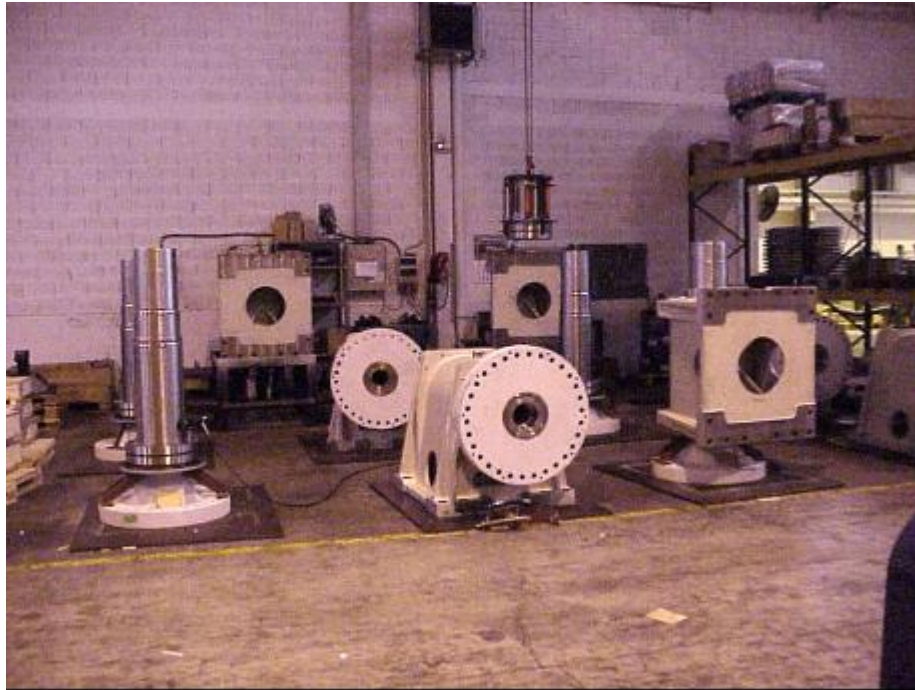
Figura 2: asse di bassa velocità