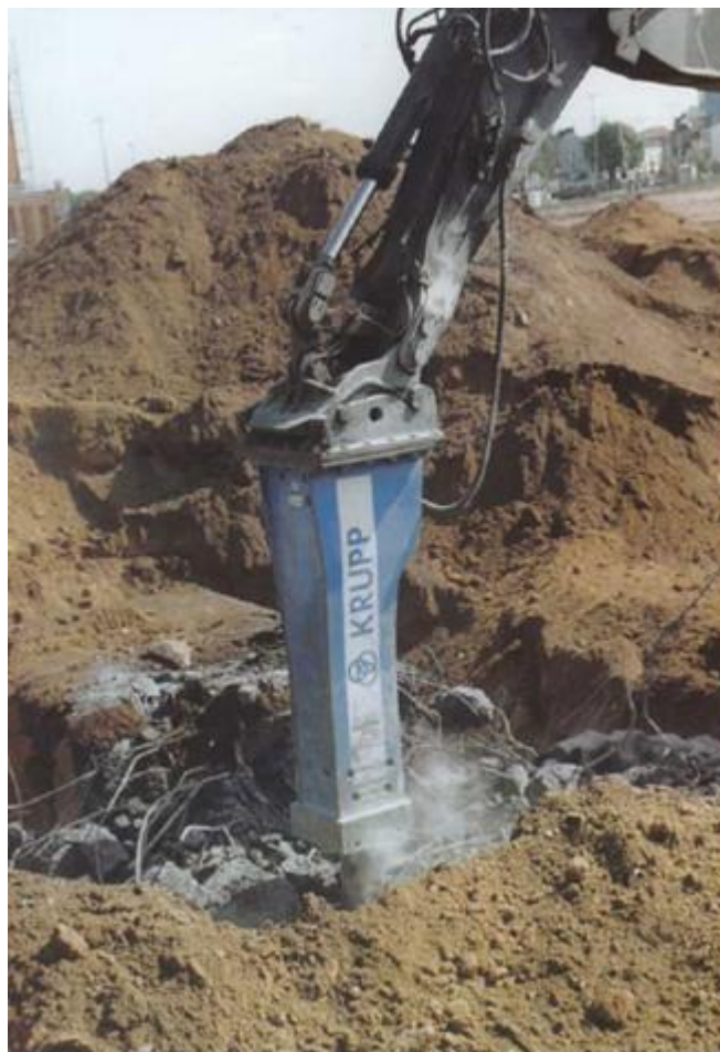
Figura 13: trivellazione

Il passo seguente sarà il taglio, mediante cesoie idrauliche, dei cavi di ferro forgiato, in modo tale che si possano separare ed essere facilmente maneggiabili. Una volta realizzato questo processo ci sono due opzioni per il ritiro e la gestione dei residui provenienti dalla demolizione.