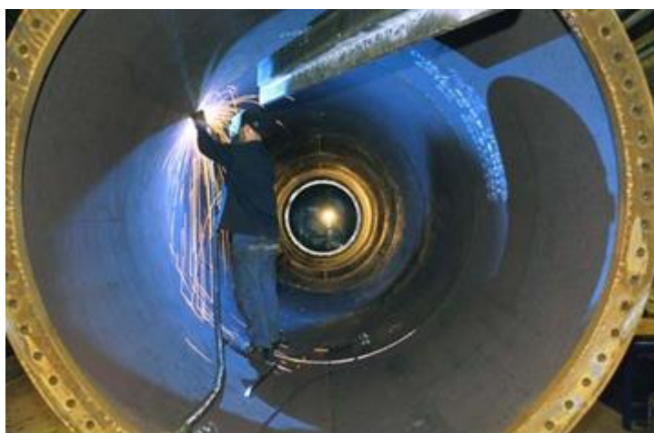
Figura 10: interno di una torre

All'interno delle torri si installano vari componenti come scale, cavi elettrici di connessione dell'aerogeneratore, porta della torre e casse di connessione. Tali torri sono fabbricate con piastre di acciaio di spessore tra i 16 e i 36 mm, che alla fine sono ricoperte al loro esterno e al loro interno da strati di pittura per proteggerli dalla corrosione. All'interno delle torri si installano una serie di piattaforme, scale e linee di vita per l'accesso degli operai all'interno della navicella. Tali componenti sono fabbricati in acciaio o ferro galvanizzato visto che all'interno sono protetti dalla corrosione.