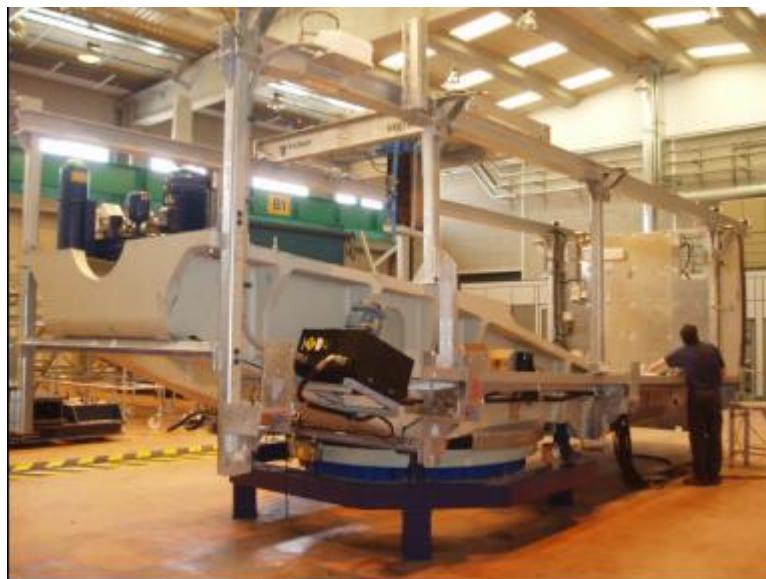
Figura 9: telaio anteriore e posteriore