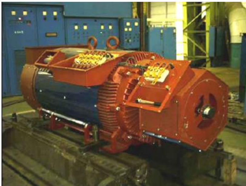
Figura 5: generatore

Tanto l'acciaio quanto il rame sono destinati al riciclaggio come rottame. Bisogna prestare particolare attenzione al recupero del rame, a causa del suo elevato costo sul mercato.