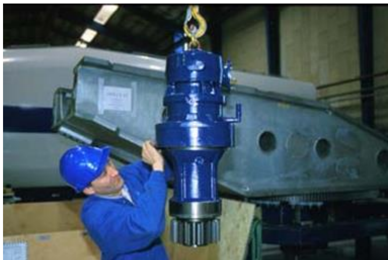
Figura 6: motori di giro e riduttori