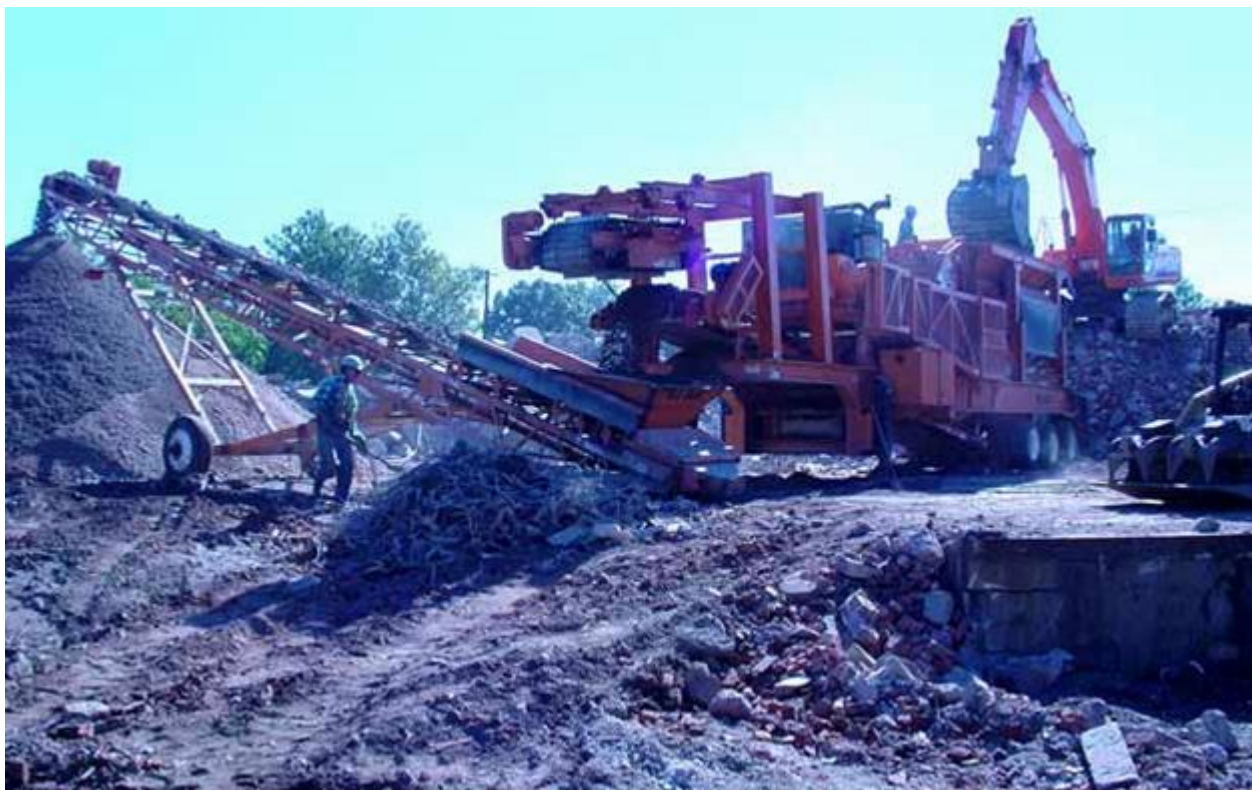
Figura 14: demolizione