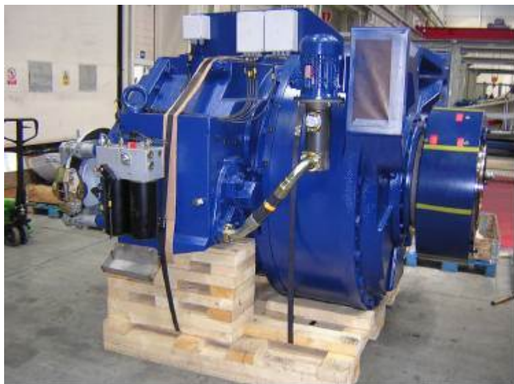
Figura 3: moltiplicatore