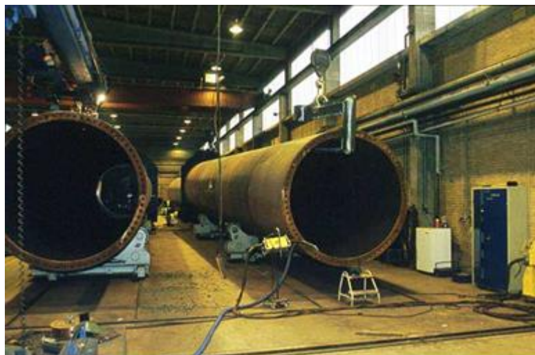
Figura 11: torri

L'opzione più attuabile relativamente alla gestione finale dei trami che costituiscono le torri è il riciclaggio come rottame.