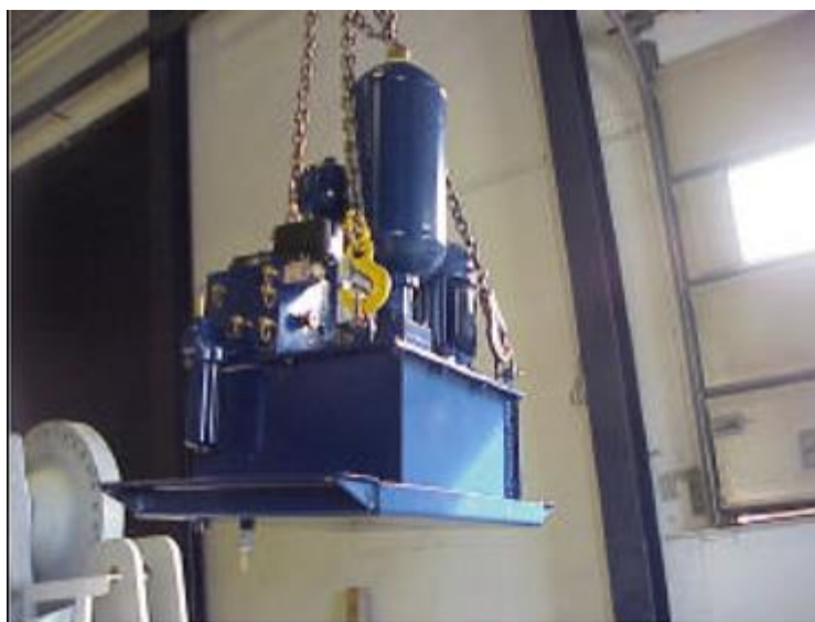
Figura 7: gruppo di pressione

Nel caso in cui si trovi in buono stato potrà essere riutilizzato come ricambio.