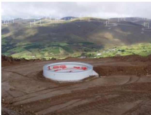
Figura 12: fondazione