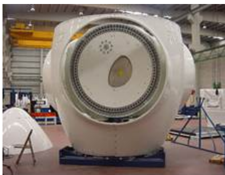
Figura 1: mozzo

Il riutilizzo come componenti di seconda mano è particolarmente ristretto per il mozzo, data la necessità di resistenza strutturale che si esige per questo componente. Questi componenti alla fine vengono riciclati come rottame di acciaio.