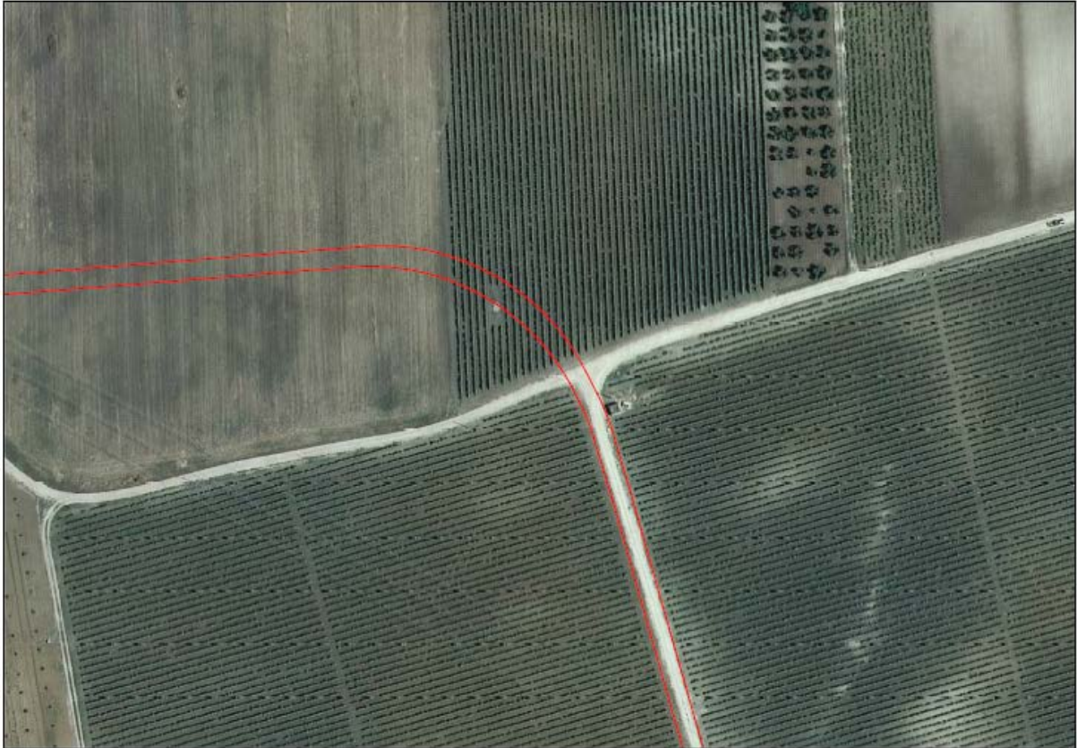
500 mq di vigneto da svellire per accesso aerogeneratore AV03

Negli interventi di realizzazione delle piste di cantiere e delle piazzole verrà garantita la regimazione delle acque meteoriche mediante la verifica della funzionalità idraulica della rete naturale esistente.