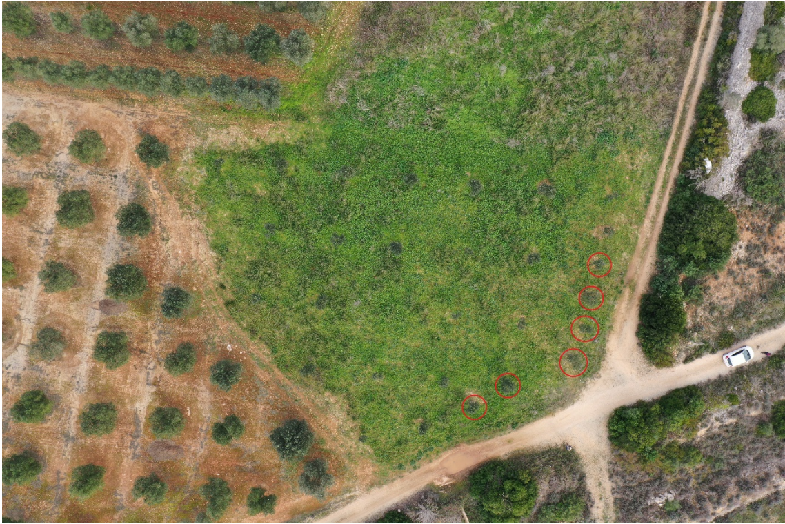
Zona A - n. 6 ulivi da espiantare