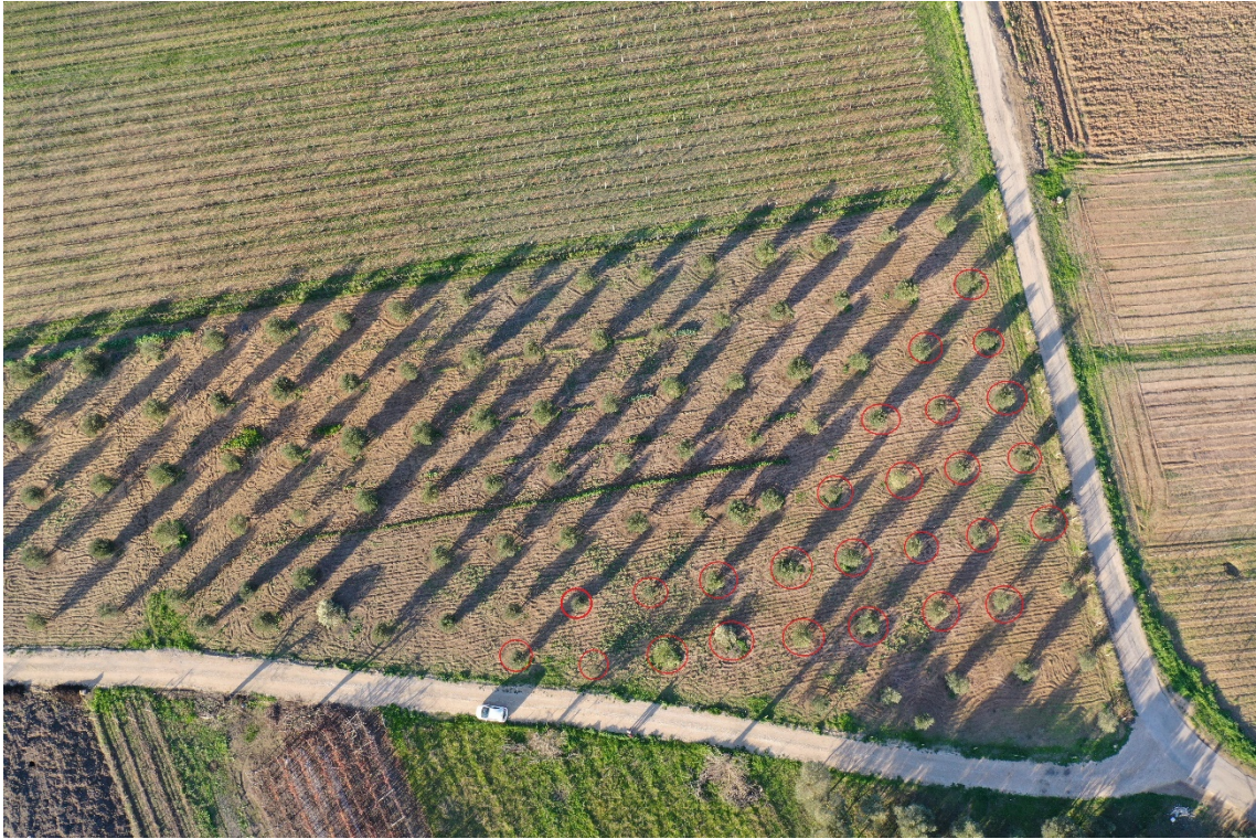
Zona D - n. 26 ulivi da espantare