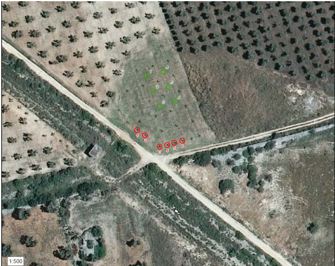
Zona A - posizioni di espianto (in rosso) e reimpianto (in verde)