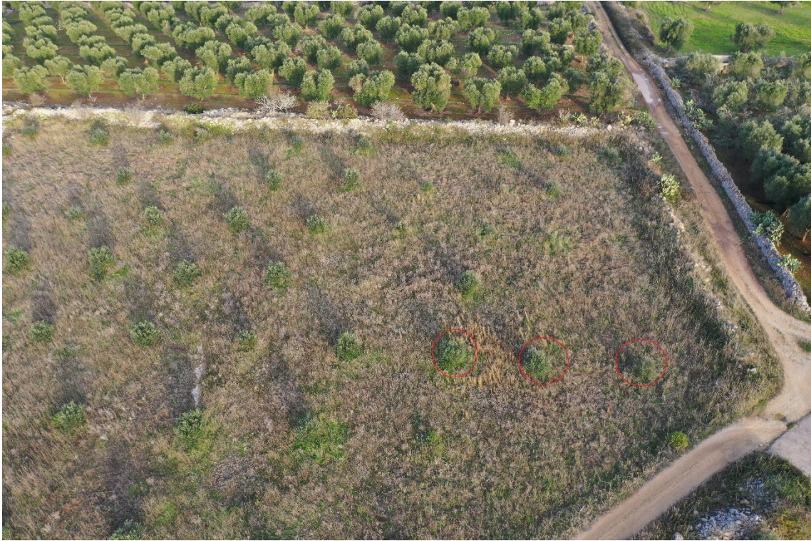
Zona B - n. 3 ulivi da espiantare