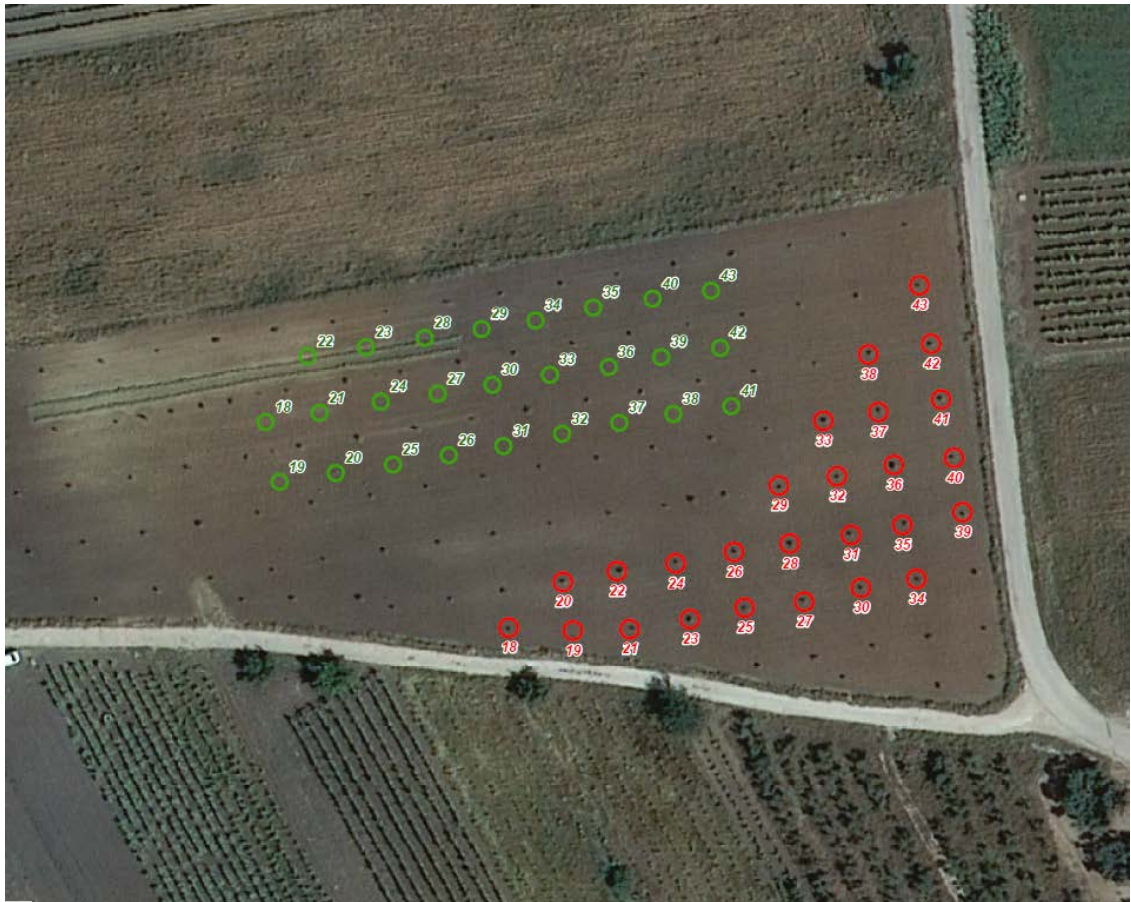
Zona D - posizioni di espanto (in rosso) e reimpianto (in verde)