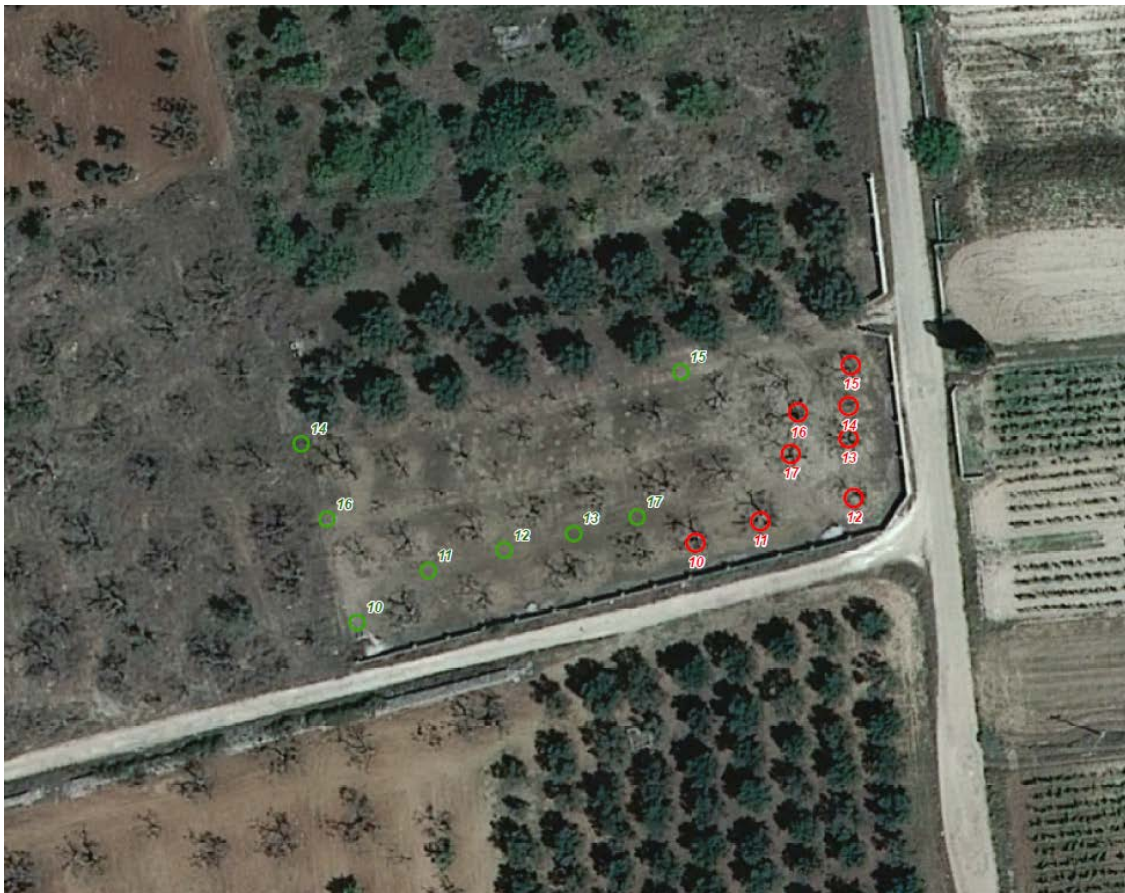
Zona C - posizioni di espianto (in rosso) e reimpianto (in verde)