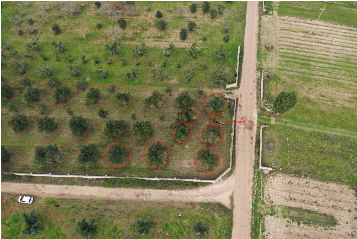
Zona C - n. 8 ulivi da espiantare