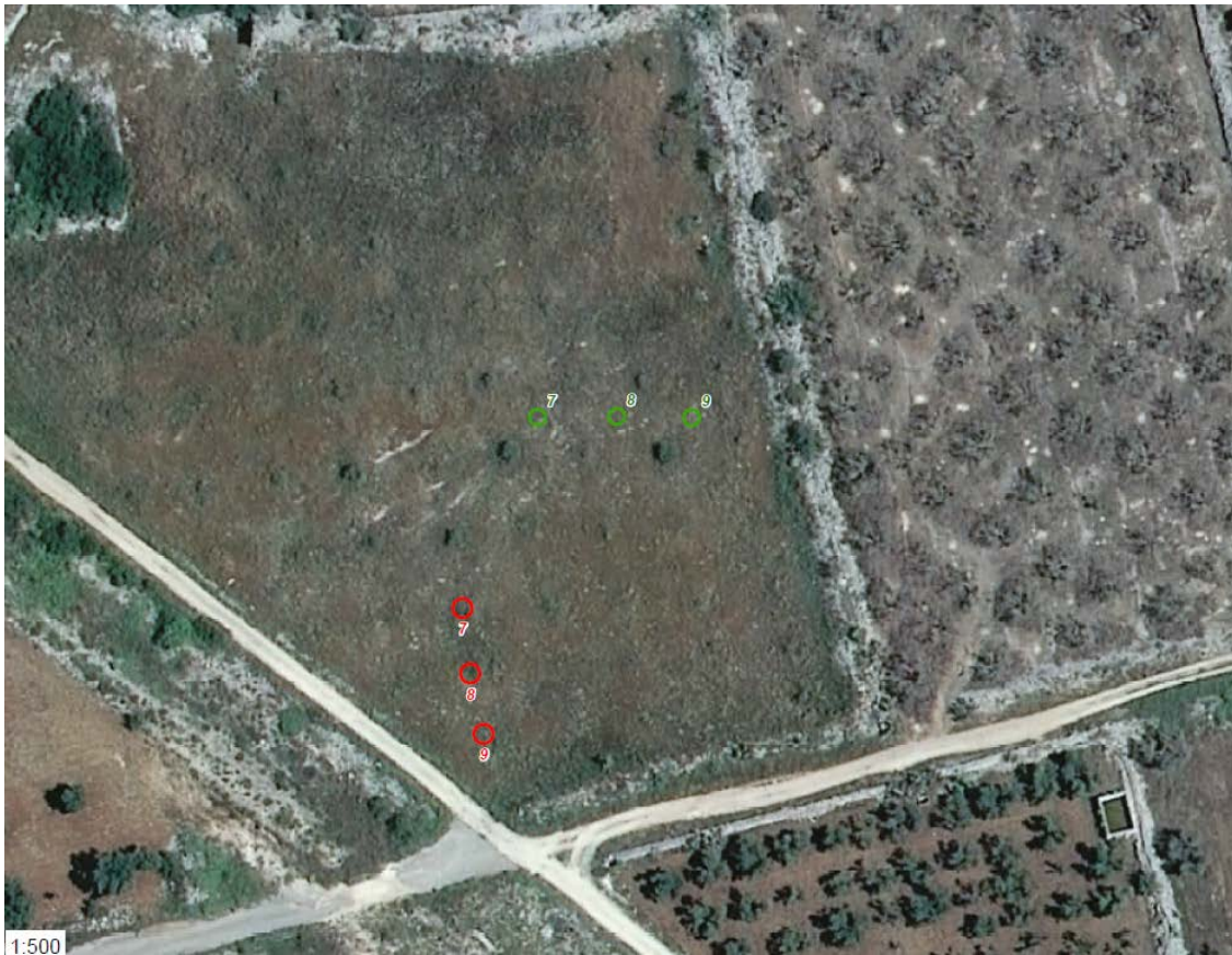
Zona B - posizioni di espianto (in rosso) e reimpianto (in verde)