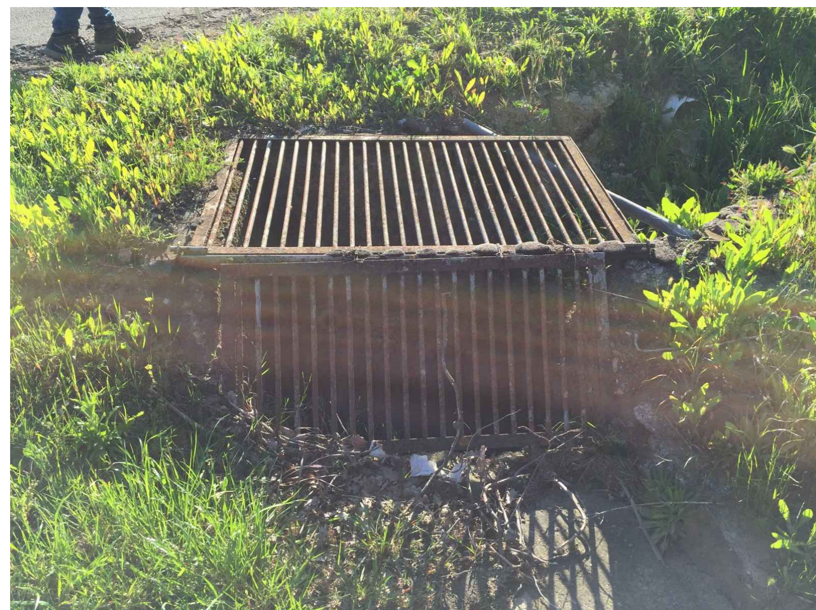
OPERA 10 - PONTICELLO