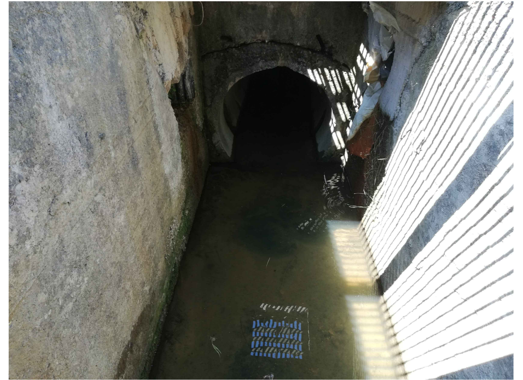
OPERA 1 - TOMBINO Ø900