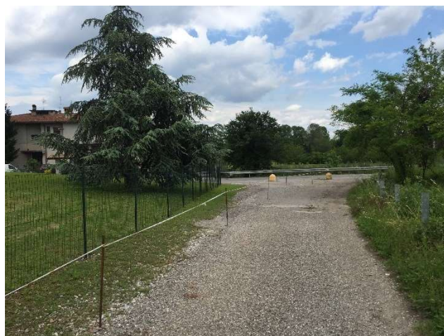
Innesto strada campestre su Via Cavour