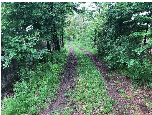
Strada campestre esistente

A sud della strada campestre, è presente una canaletta irrigua prefabbricata, corrispondente alla Roggia Calcinatella del Consorzio di Bonifica del Chiese. Il tracciato di progetto intercetta il canale solamente in corrispondenza della curva destrorsa, e l'interferenza viene risolta mediante un nuovo sifone. Nel rimanente tratto, il tracciato si sviluppa in direzione parallela al canale senza ulteriori interferenze con la Roggia.