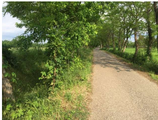
Strada collegamento Via Manzoni-Via Cavour

Il tracciato dell'asse principale della viabilità in esame risulta in continuità con il tracciato del sottopasso podereale SLZ3, ha un'estensione complessiva pari a 684 m circa, e risulta interamente in rilevato.