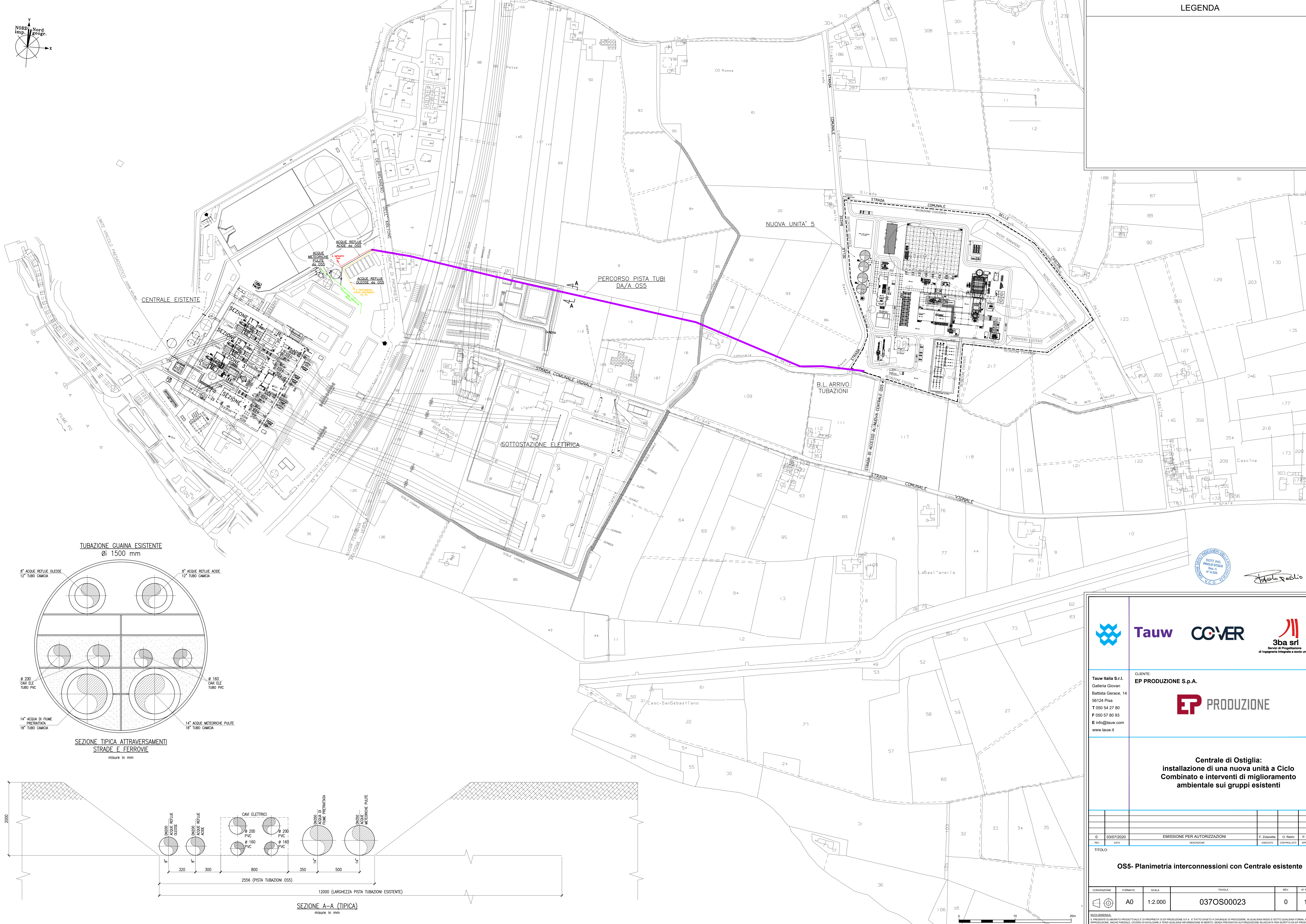
TUBAZIONE GUAINA ESISTENTE Ø1 1500 mm