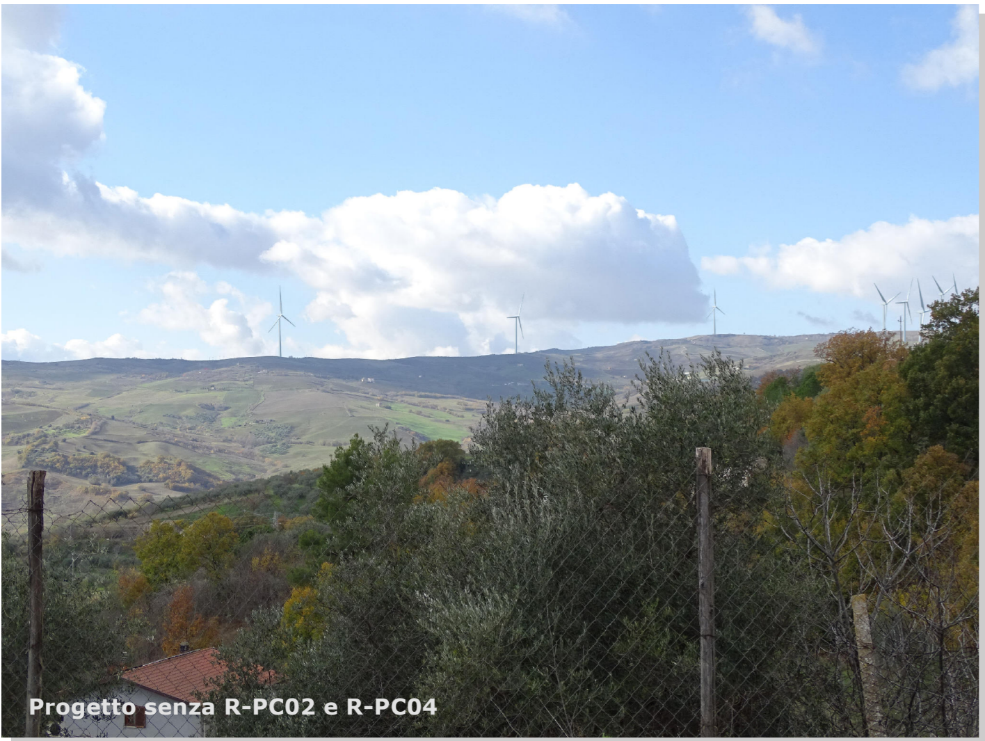
Progetto senza R-PC02 e R-PC04