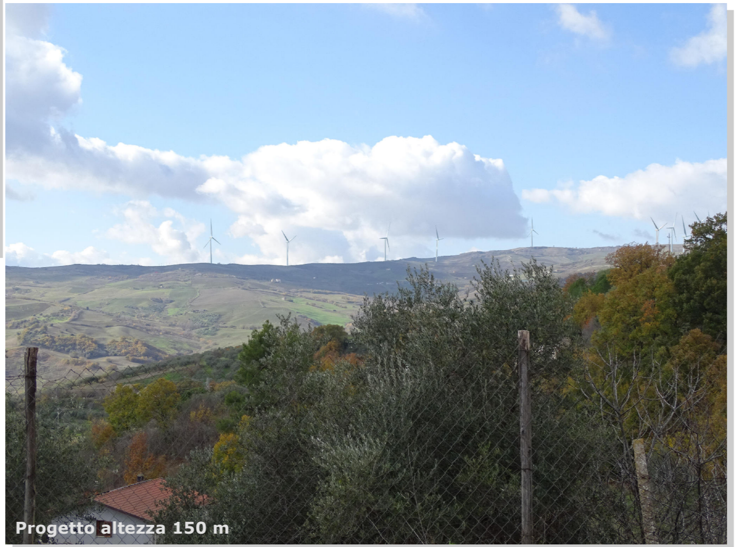
Progetto altezza 150 m