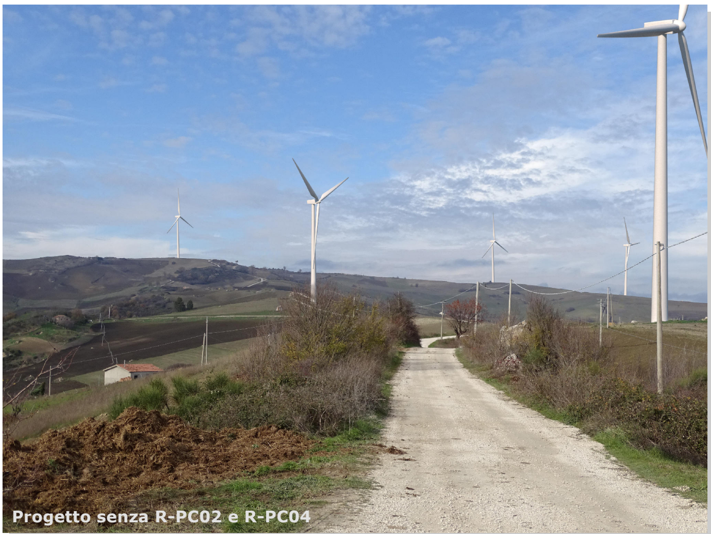
Progetto senza R-PC02 e R-PC04