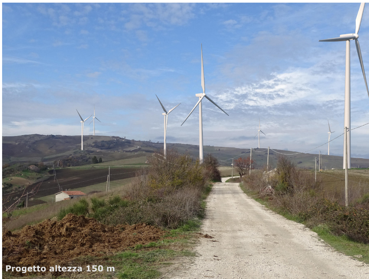
Progetto altezza 150 m