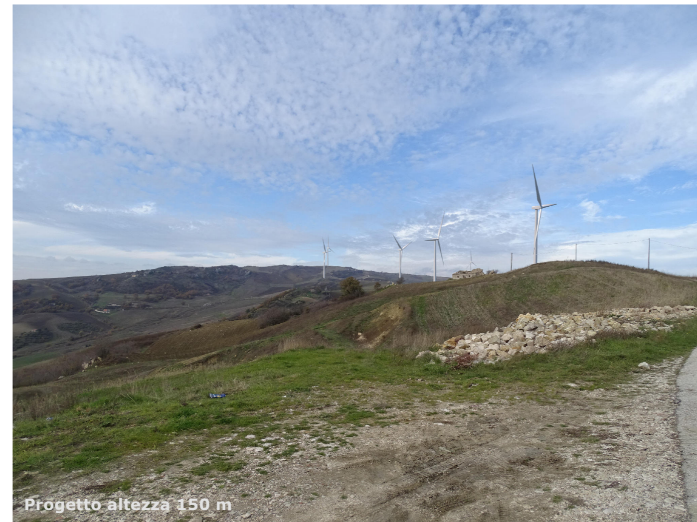
Progetto altezza 150 m