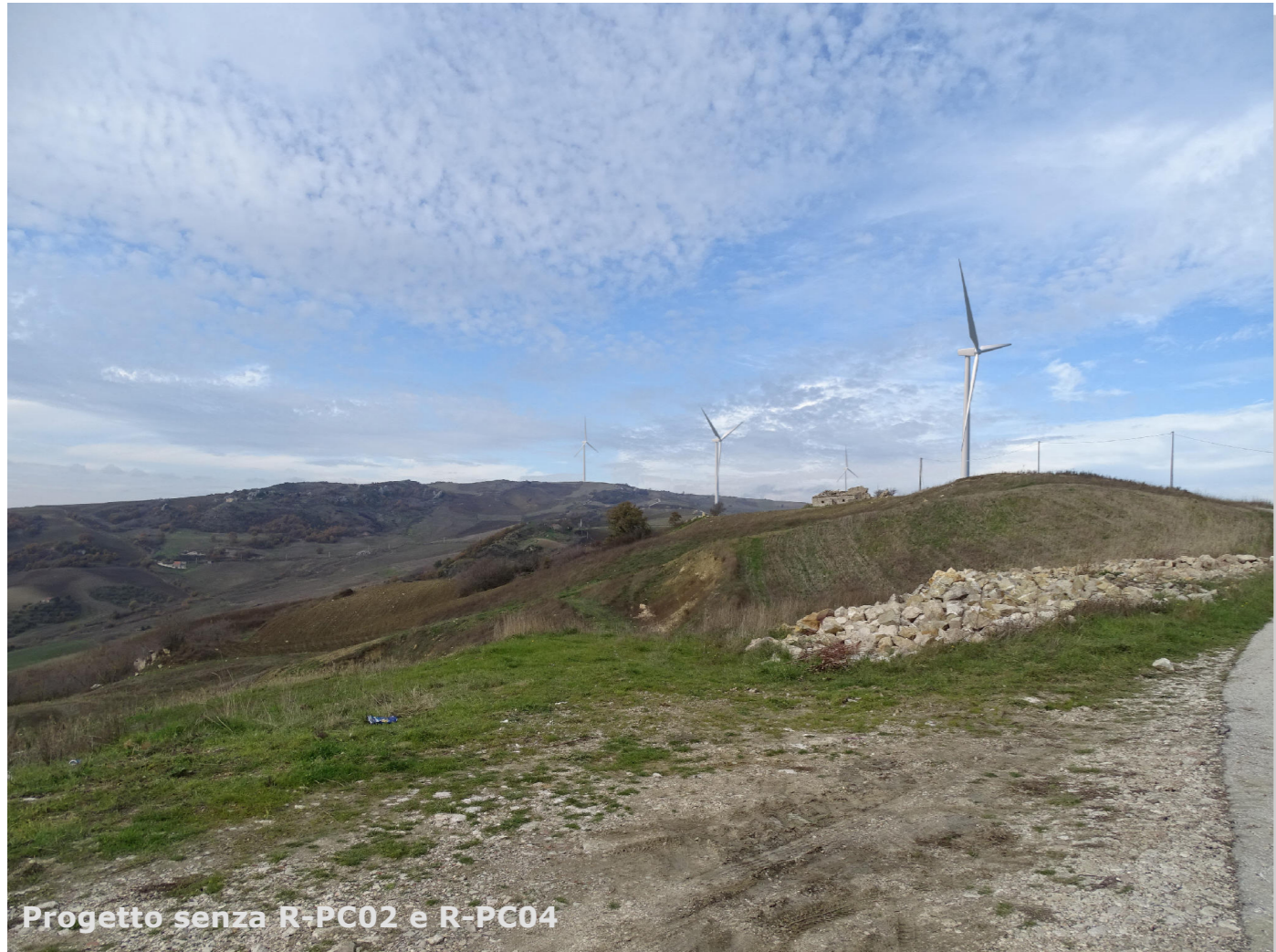
Progetto senza R-PC02 e R-PC04