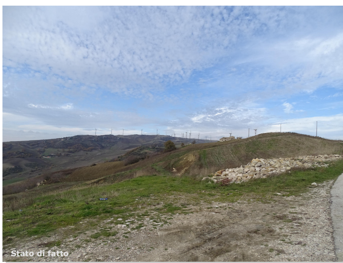
Stato di fatto