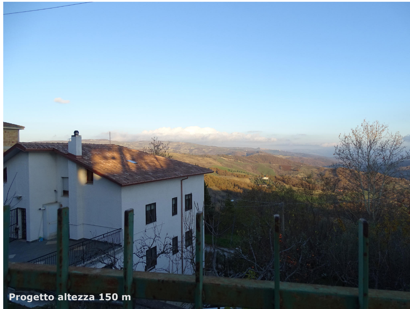
Progetto altezza 150 m