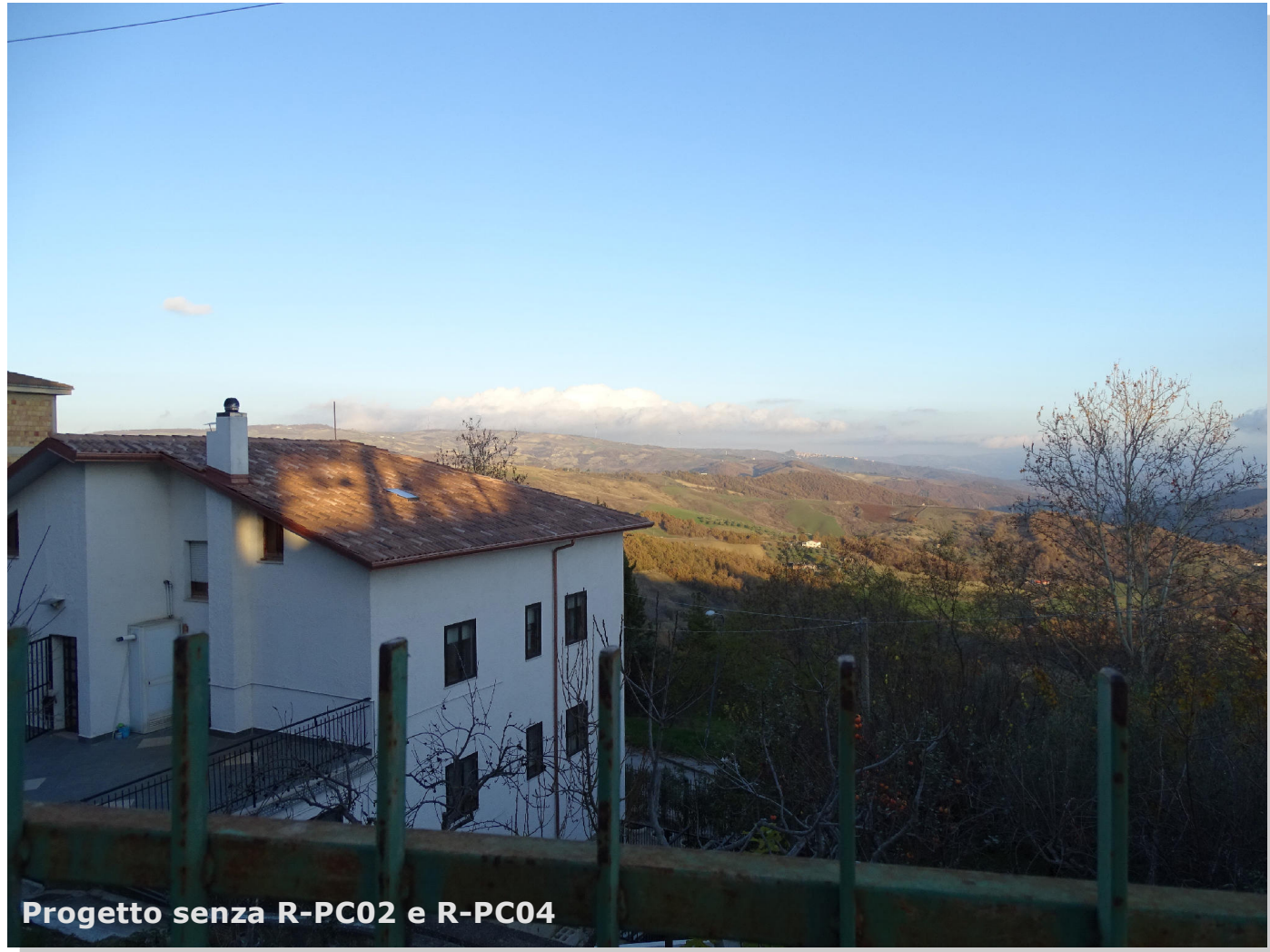
Progetto senza R-PC02 e R-PC04