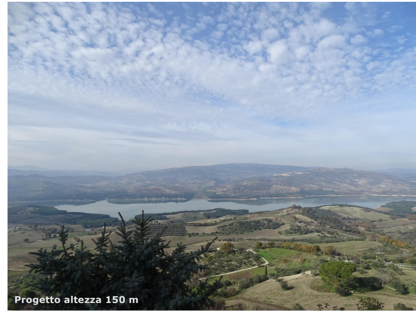
Progetto altezza 150 m