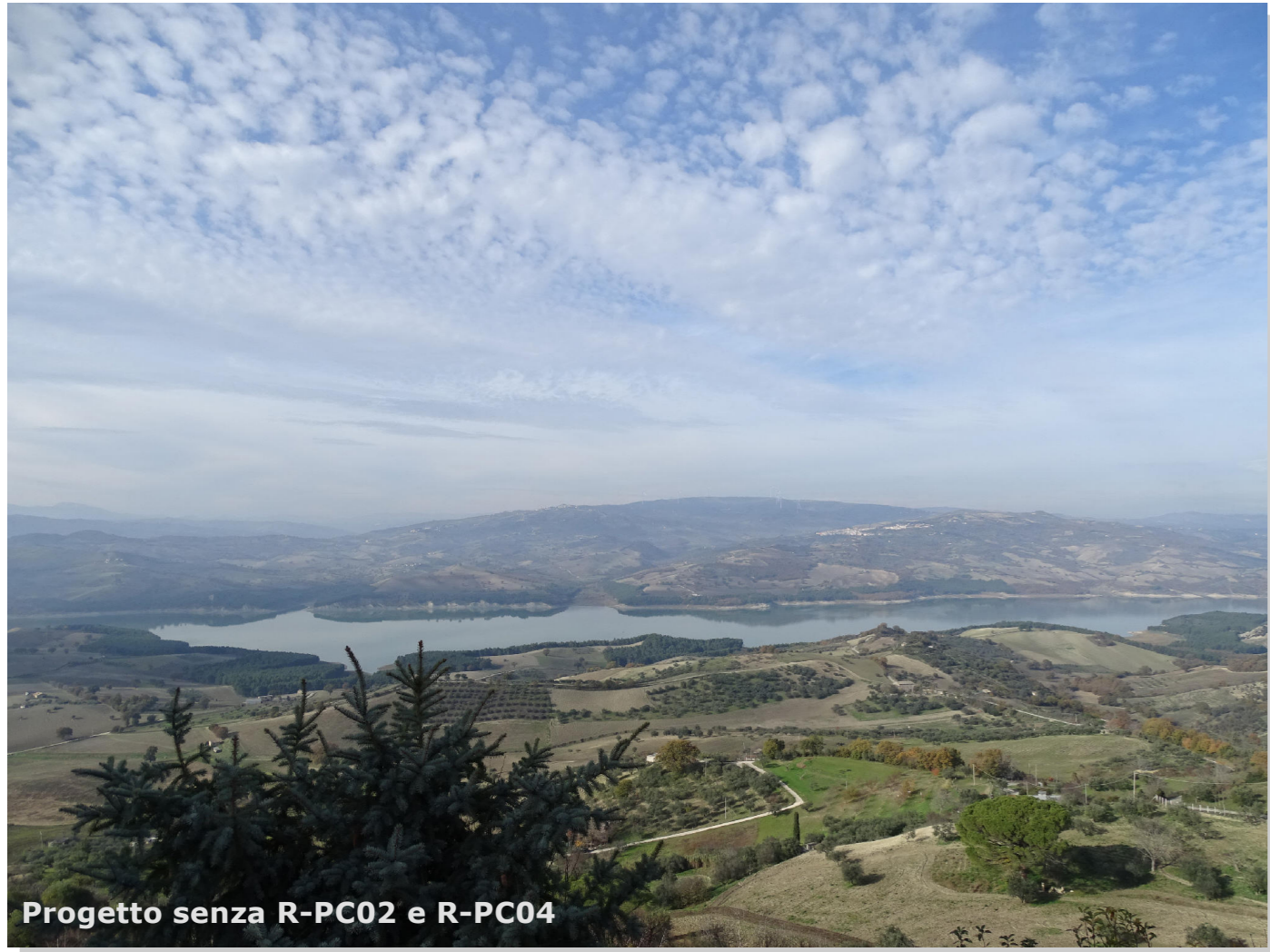
Progetto senza R-PC02 e R-PC04