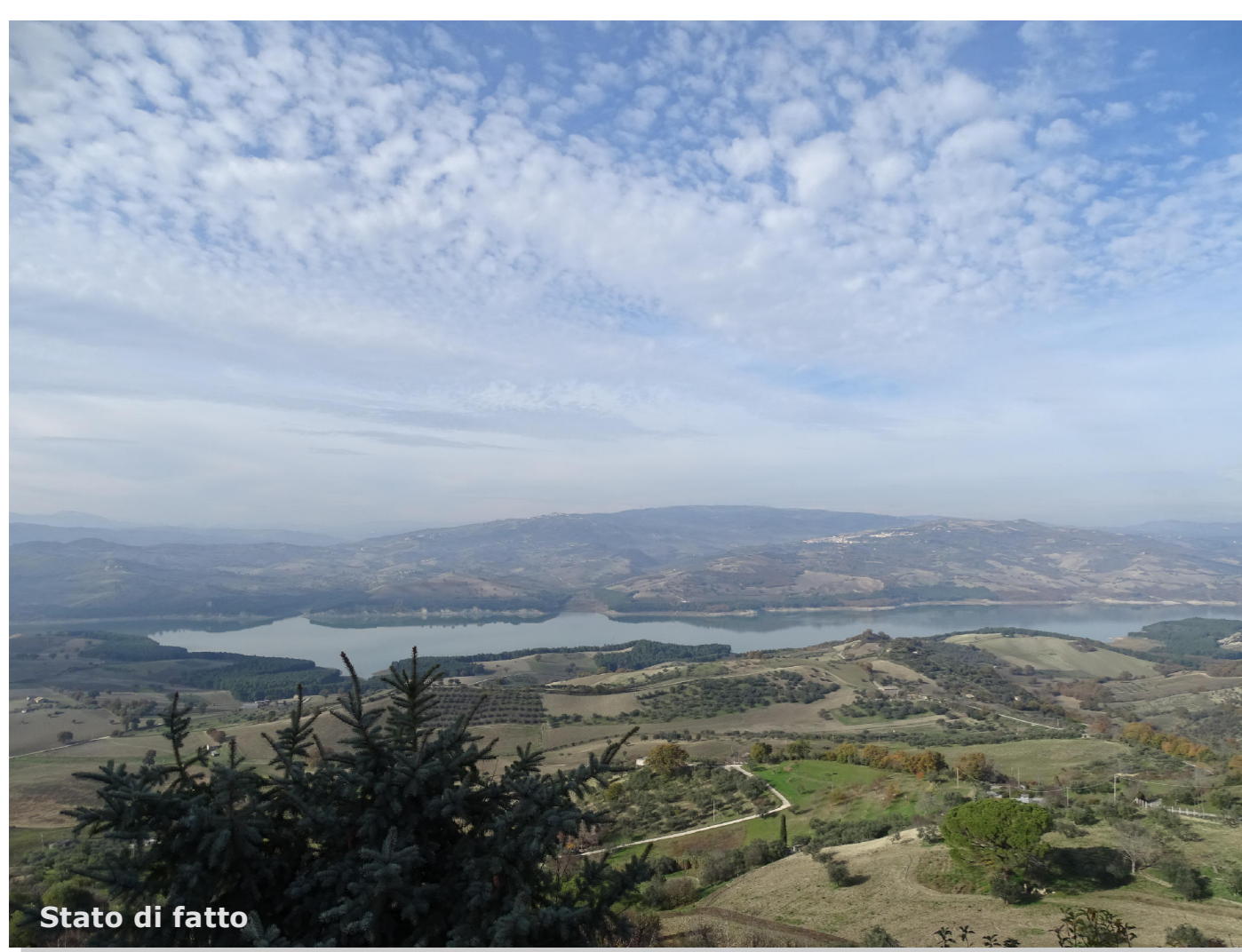
Stato di fatto