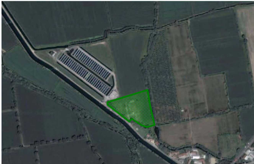
Zoom su foto aerea dell'area di centrale