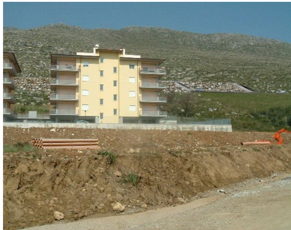
2. Vista dello imbocco lato sud-est della galleria artificiale "Campese 2"