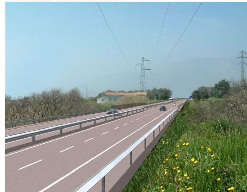
3. Vista del ponte a tre campate "Acquatrasera"