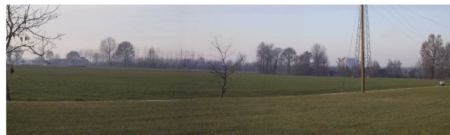
Campo di granoturco. Sullo sfondo si vede il filare di pioppi che delimita il sito ipotizzato per la localizzazione del cluster B