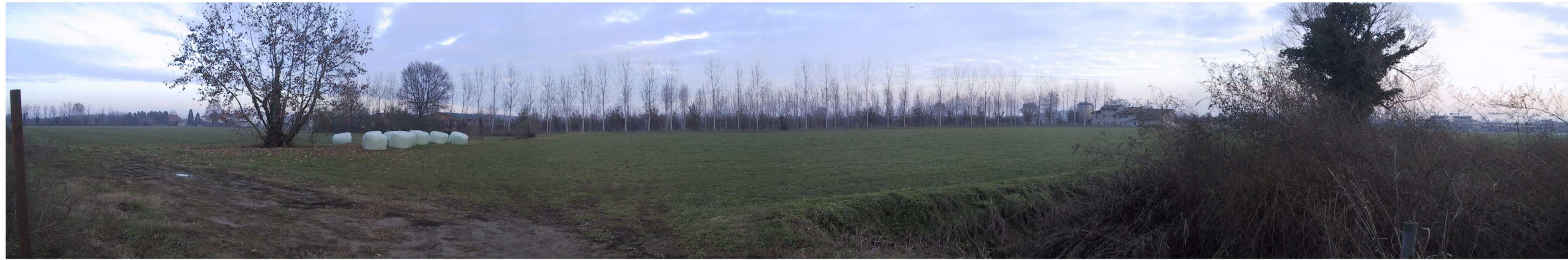
Area adiacente cluster B: presenza di campo a foraggio. Sullo sfondo la zona del cluster B oggi adibita a bosco ceduo da taglio in abbandono