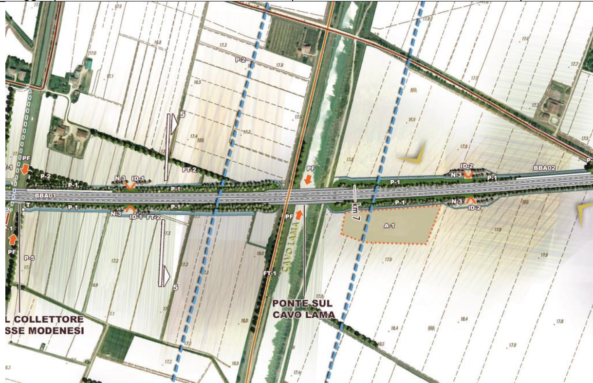
STRALCIO DELLA PLANIMETRIA CON INDICAZIONE DEGLI INTERVENTI DI INSERIMENTO PAESAGGISTICO E DI MITIGAZIONE E COMPENSAZIONE AGRO-AMBIENTALE