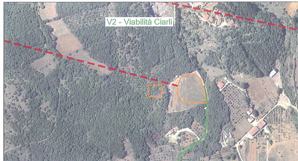
ACCESSO CENTRALE (CANTIERE No. 4)