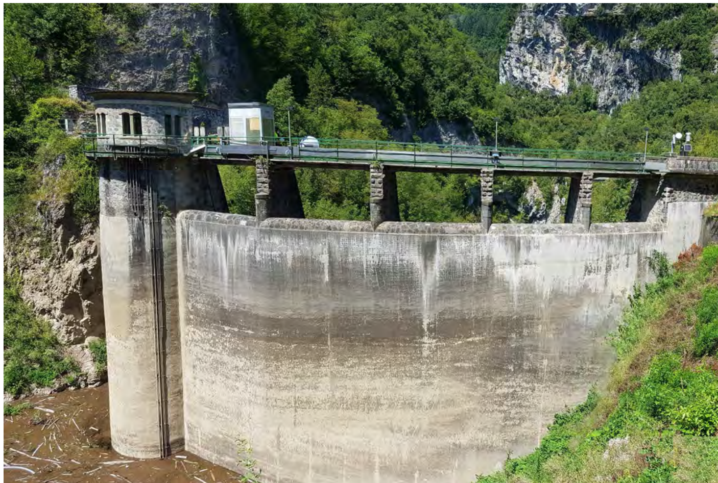
Stato attuale: foto paramento di monte della Diga