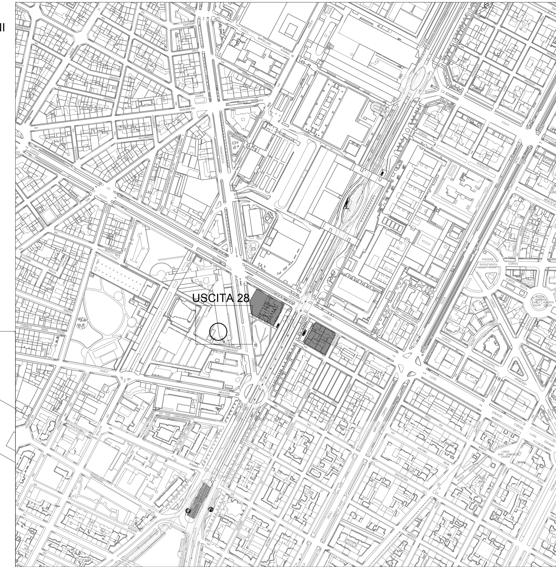
STRALCIO PLANIMETRICO USCITE n.28 SCALA 1:200