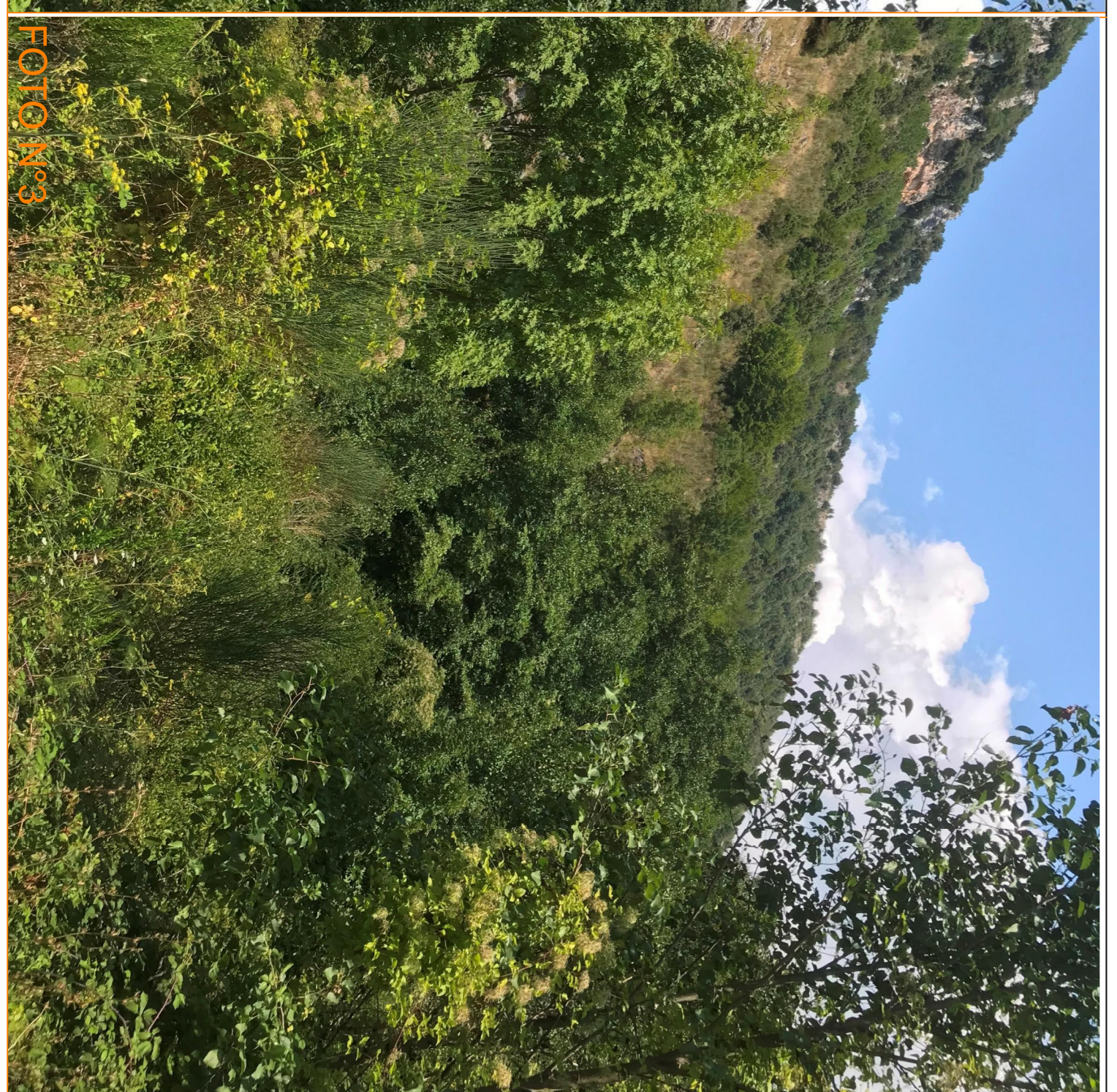
FOTO M1 FOTO M2 FOTO M3