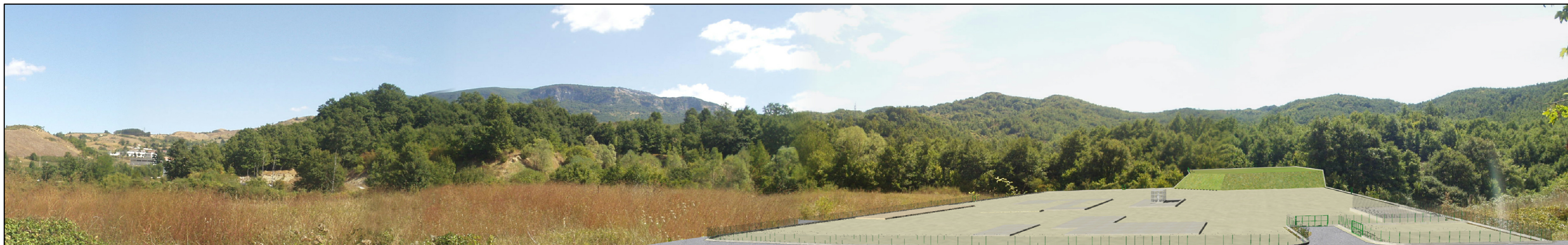
SIMULAZIONE: RIPRISTINO PARZIALE