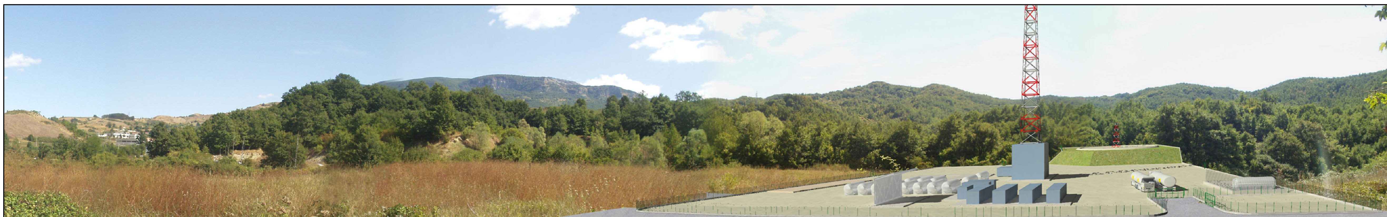
SIMULAZIONE: FASE DI PERFORAZIONE