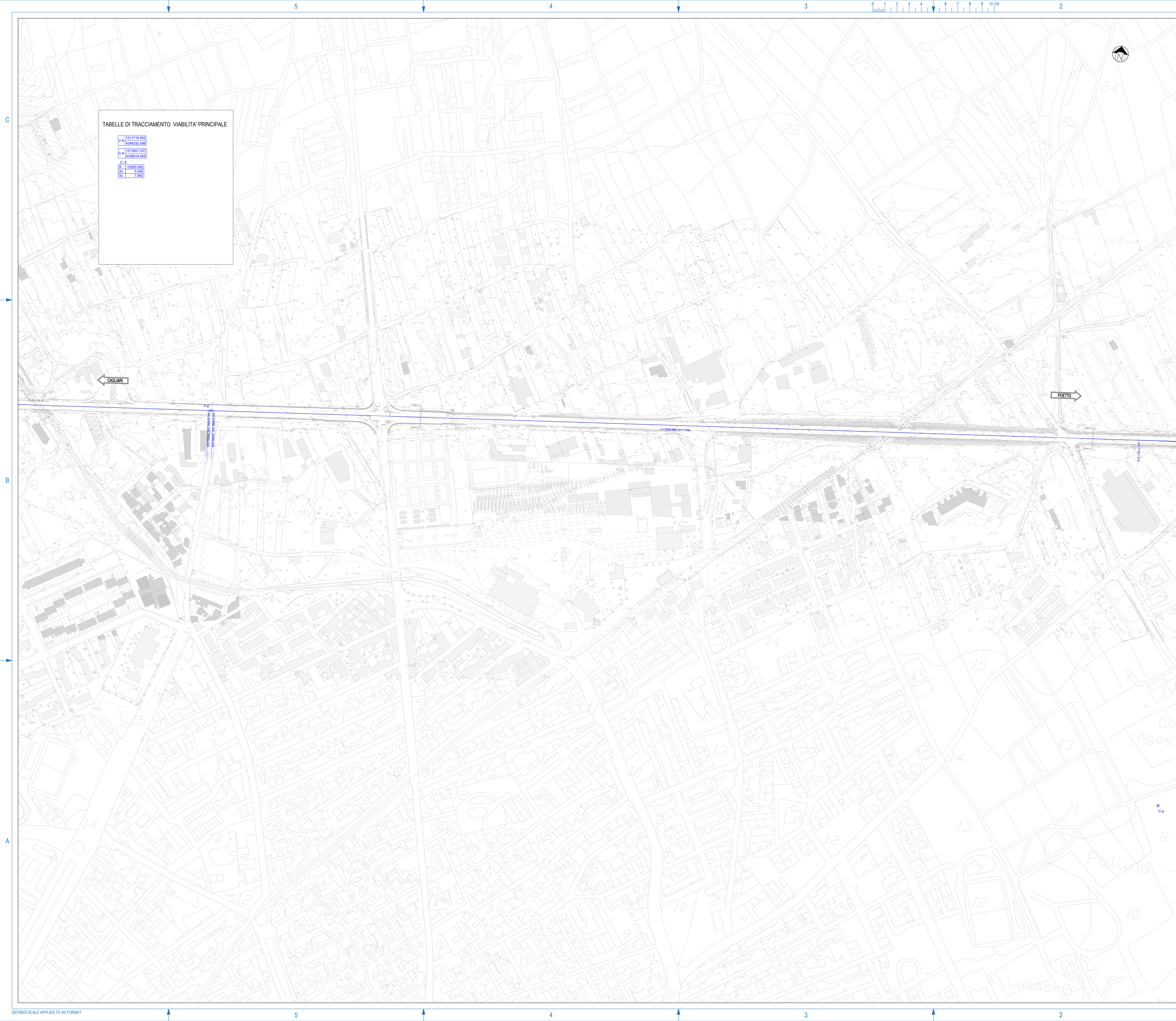
TABELLE DI TRACCIAMENTO VIABILITA' PRINCIPALE